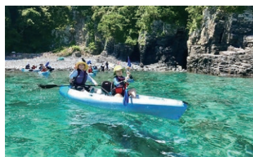
シーカヤック(対馬市)

④ 「しま」でプログラムを体験し、料金を観光体験クーポンで支払い(差額は現金でお支払いください)