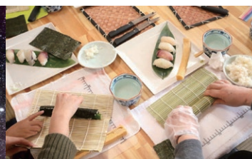
お寿司塾体験(壱岐市)