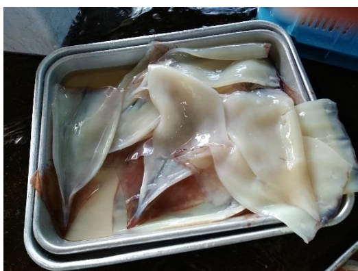
捌いたスルメイカ

出荷されるスルメイカ：船上で釣り上げ後すぐに、大きさ別に氷を敷いた箱に並べられて、そのまま各地の市場までフタを開けることなく流通することで鮮度を保ちます。