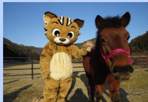
ろくべえ(対馬振興局所属キャラクター)と対州馬