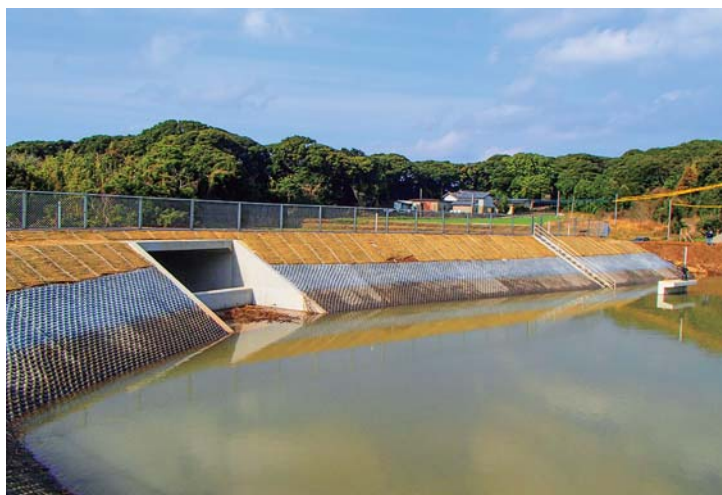
老朽ため池の整備「泉ヶ山ため池」(沓崎市)