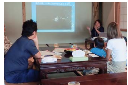
お試し移住体験（移住相談役による集落説明）