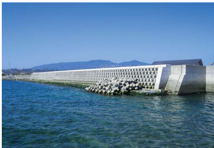
海岸保全施設の整備「有馬2期地区」(南島原市)