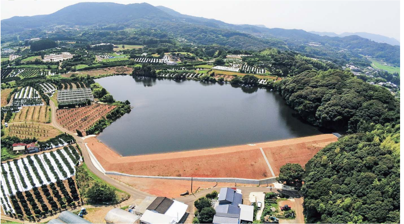
老朽ため池の整備状況「六郎ため池」(佐世保市)