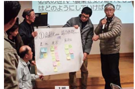
移住受入等集落ビジョンの検討