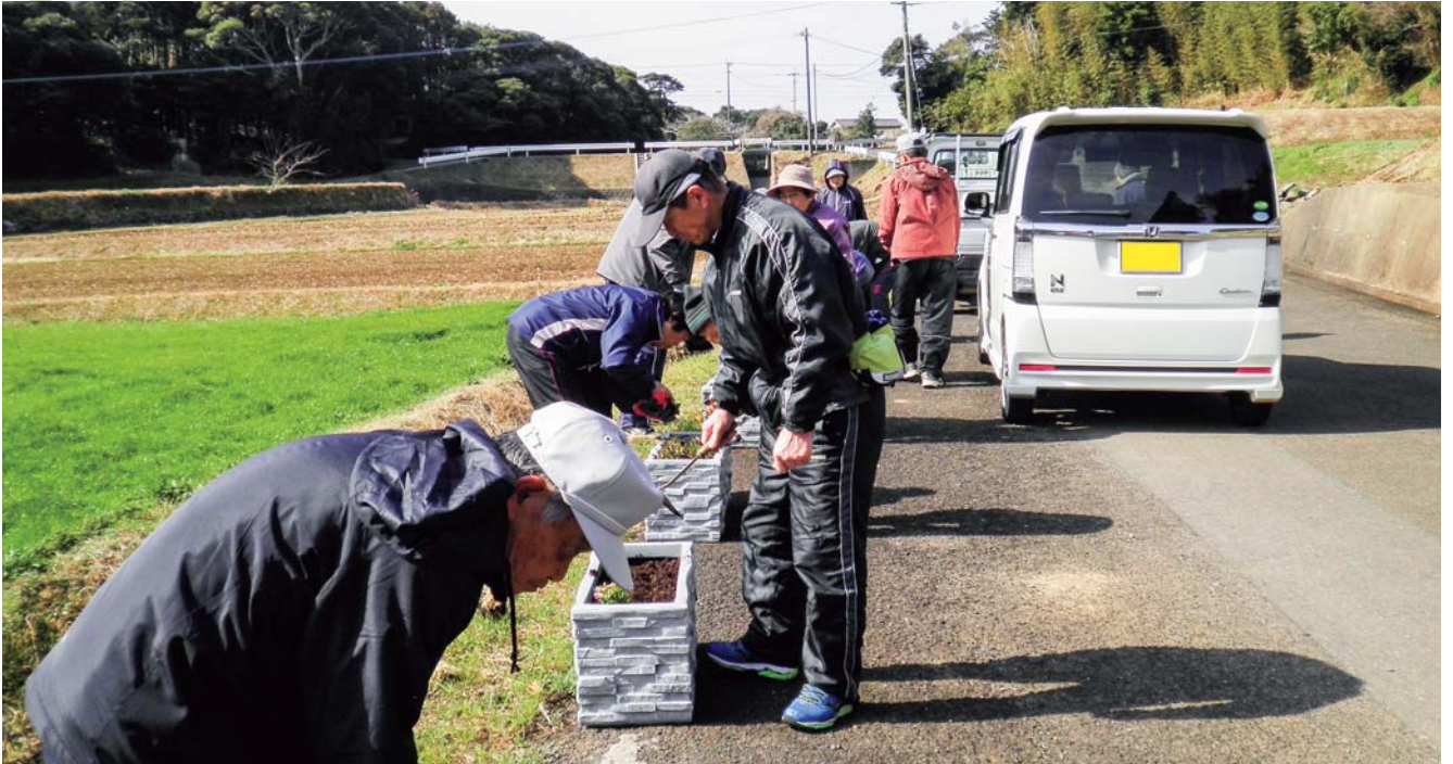
多面的機能支払活動組織による植栽活動