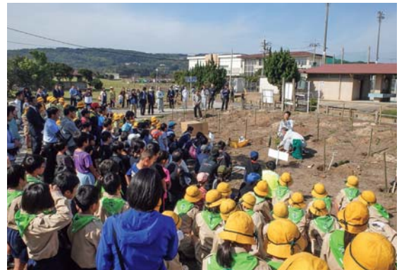
小学生による植樹活動