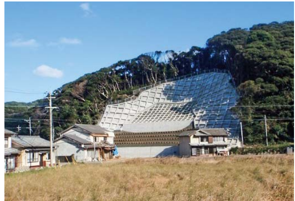
山地災害の復旧（吉崎市勝本町藪田地区）