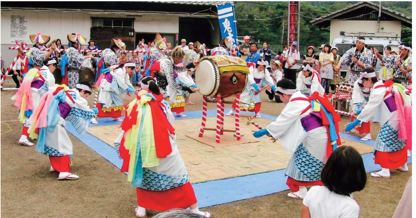
農山村集落の魅力の発信、伝統の継承