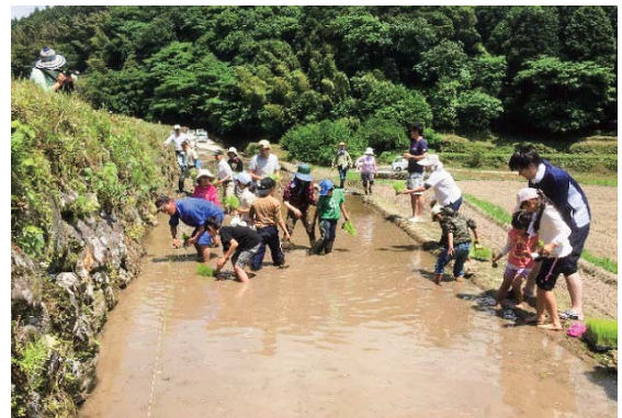
農山村集落での体験・交流プログラム