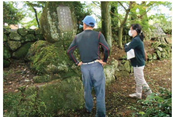
農山村モデル集落の現地調査