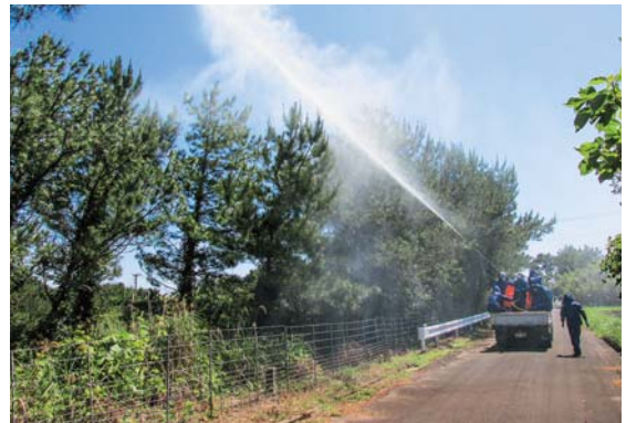
病虫害防除（農薬散布）