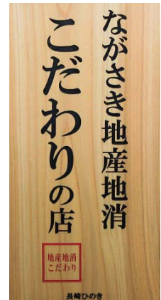
「ながさき地産地消こだわりの店」の看板