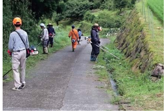
農道の維持・保全（草刈り）