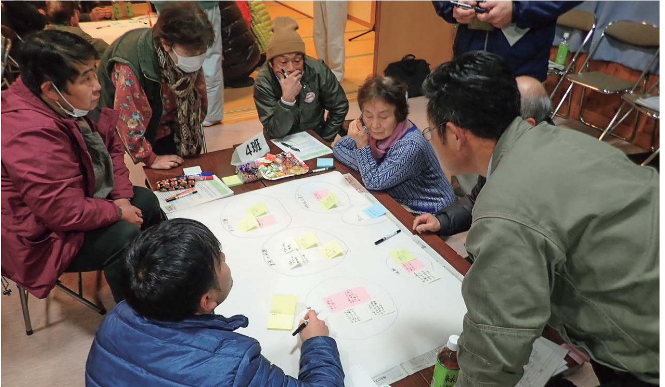
集落による将来ビジョンの検討会