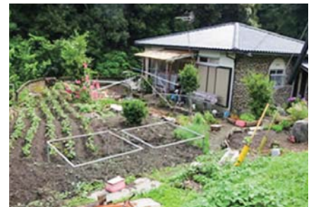
農地付空き家のイメージ