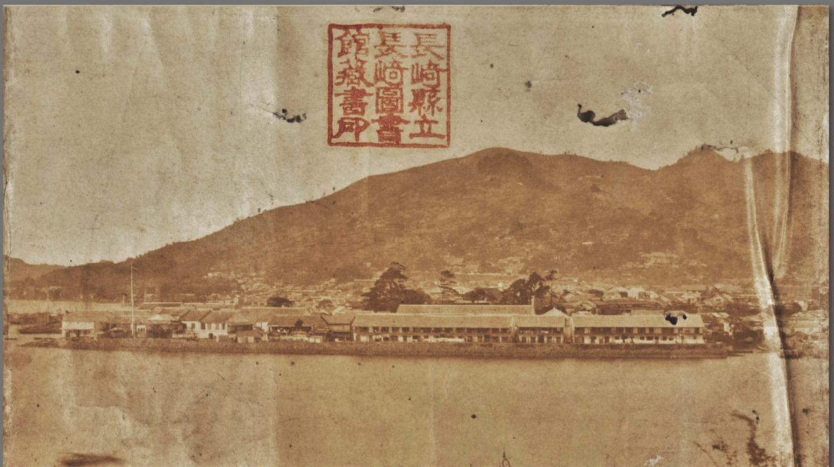
※ 元の写真画像のコントラストを調整しています。