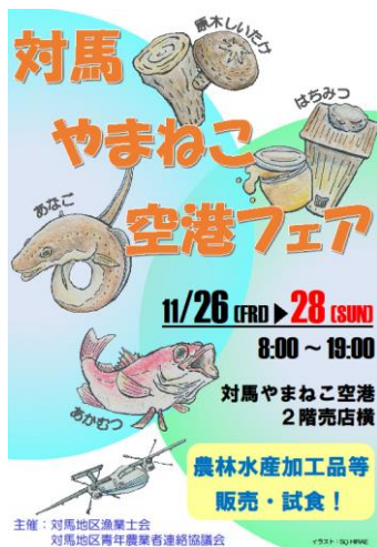
空港フェアポスター

今後、対馬における新しい特産品が創出されることに期待して、来年もフェアを支援したいと思います。