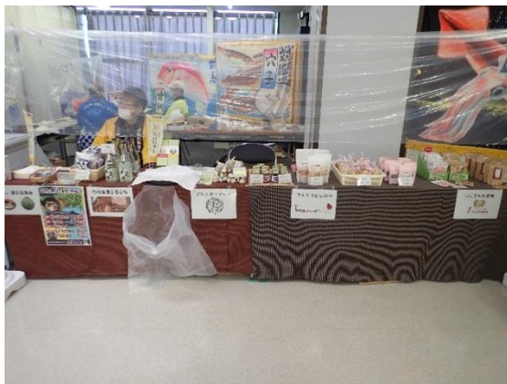
農林業者販売コーナー