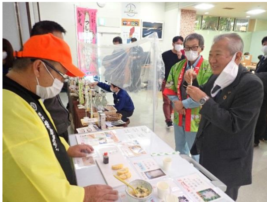
比田勝市長による激励