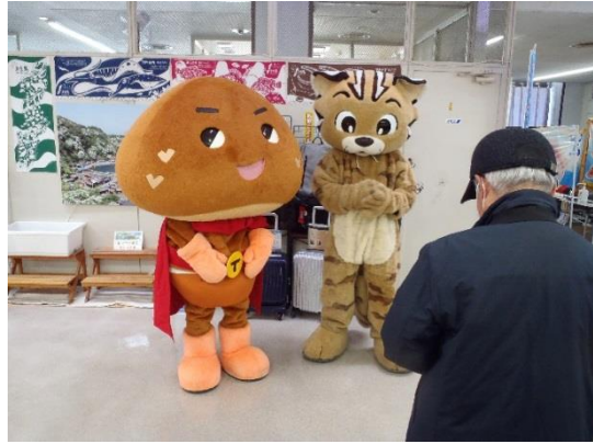
着ぐるみによる集客