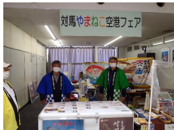
水産業者販売コーナー