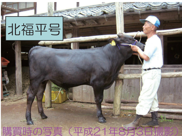
購買時の写真（平成21年8月3日撮影）

今年度第2回目の試験種付けは、 交配頭数30頭 、 交配期間11月1日～12月16日 、対象牛は郷ノ浦町産の『 北福平（きたふくひら） 』号です。試験種付けをした場合は補助金が交付されます。詳しくは家畜保健衛生所へお問い合わせ下さい。