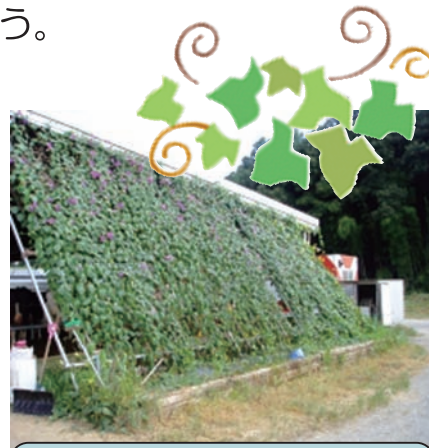
ネットに植物を這わせた緑のカーテンの一例