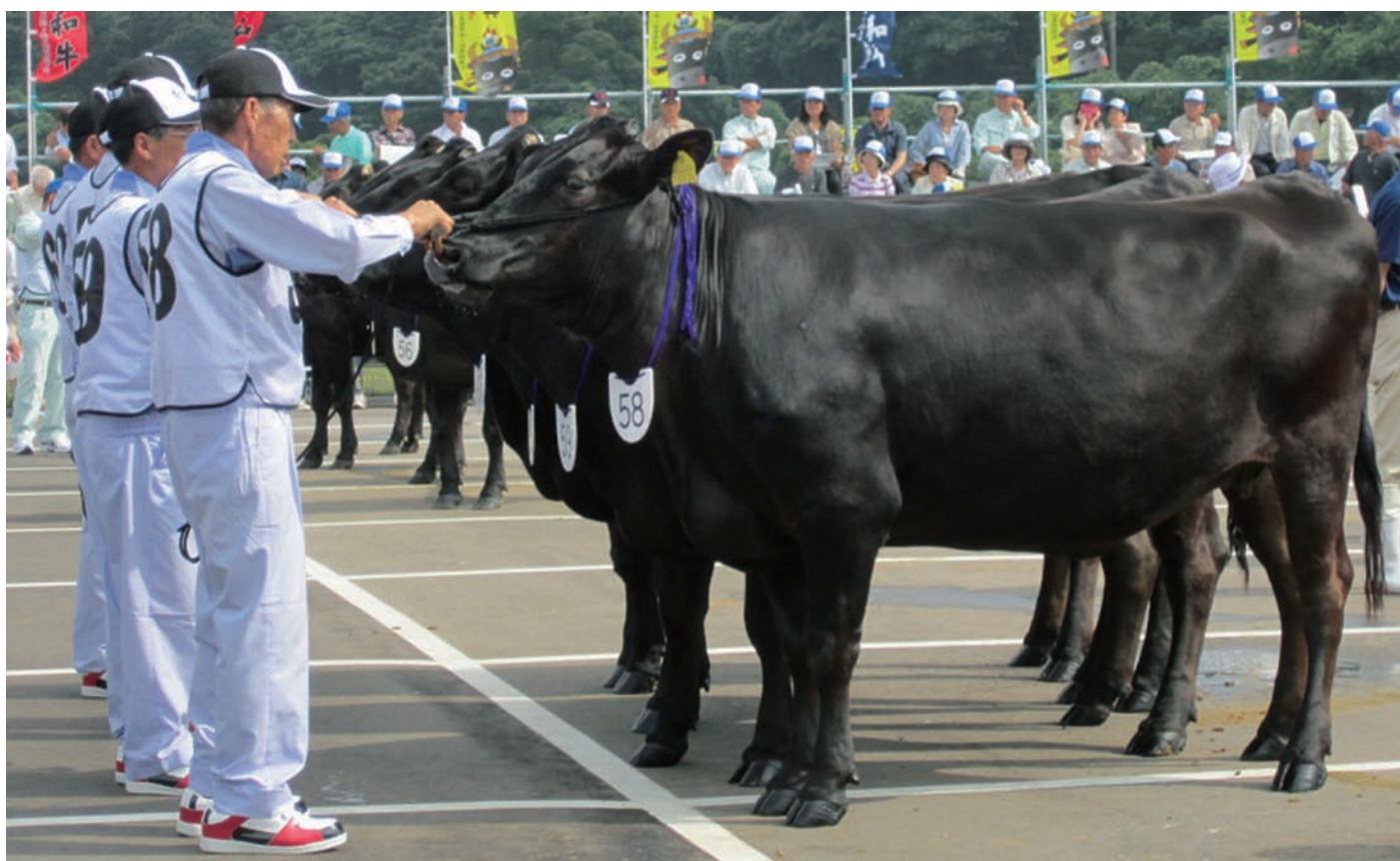
第5区代表となった4頭（たま号、はなこ号、きくはる号、はる号）

吉岐から5頭の代表牛が選ばれました！10月の本大会に向け、関係者一丸となって盛り上げていきましょう。