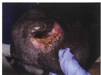
(牛) 鼻腔のびらん・痂痕化