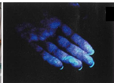
<ブラックライトを当てた手の平>

演習では、生きた鶏を使って殺処分の手順を確認しました。また今回、新たな取り組みとして、防疫作業者の防護服脱衣後の汚染状況確認を行いました。