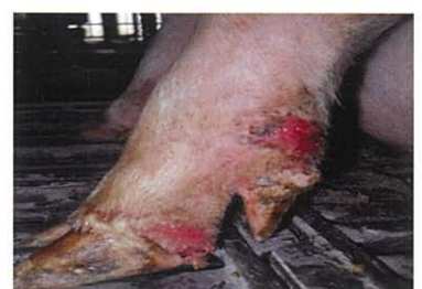
(豚) 蹄冠部のびらん