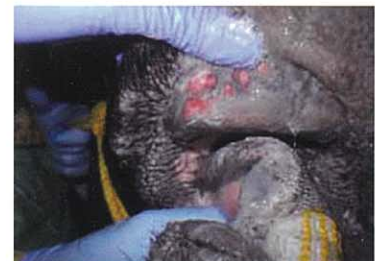
(牛) 口腔内のびらん