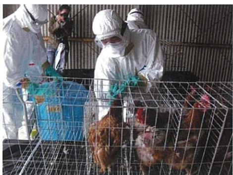
<ゲージからの捕鳥>

管内での鳥インフルエンザの発生を想定し、去る11月28日に防疫演習を実施しました。