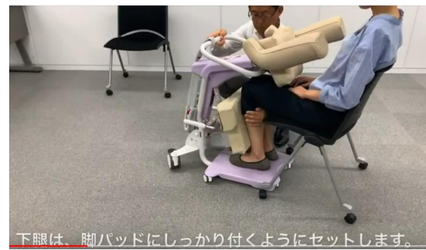
下腿は、脚パッドにしっかり付くようにセットします。