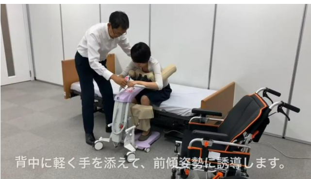
背中に軽く手を添えて、前傾姿勢に誘導します。