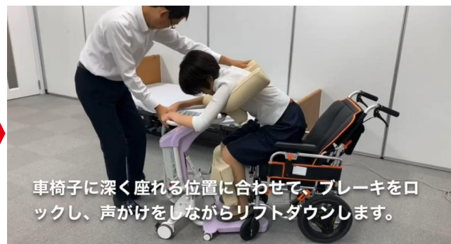
車椅子に深く座れる位置に合わせて、ブレーキをロックし、声かけをしながらリフトダウンします。