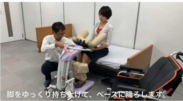
脚をゆっくり持ち上げて、ベースに降ろします。