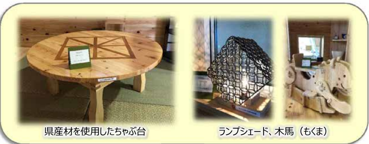
県産材を使用したちゃぶ台