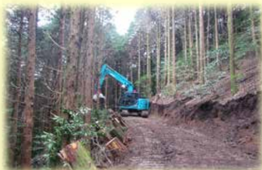
森林作業道開設状況