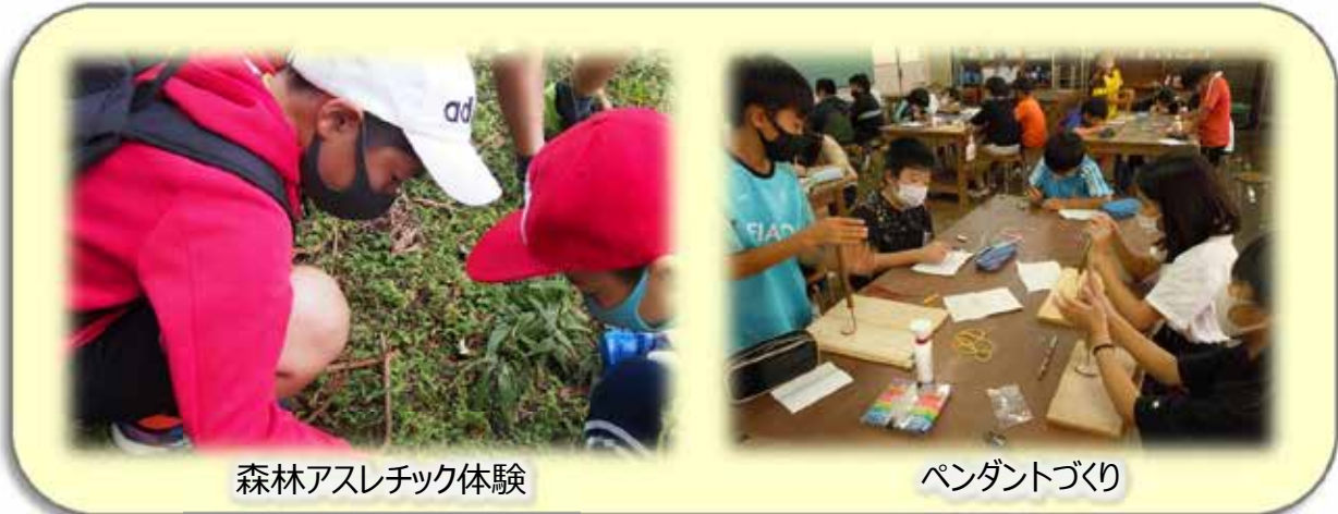
森林アスレチック体験