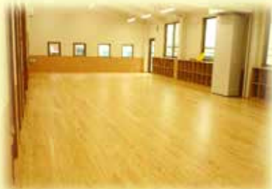
保育スペースの木質化