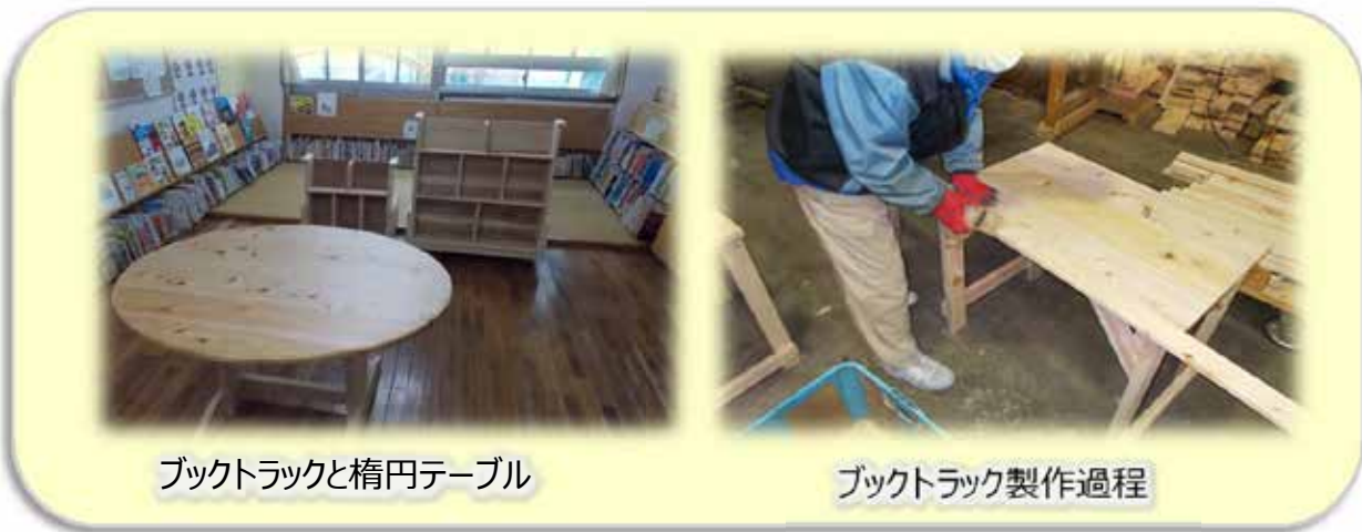
ブックトラックと楕円テーブル