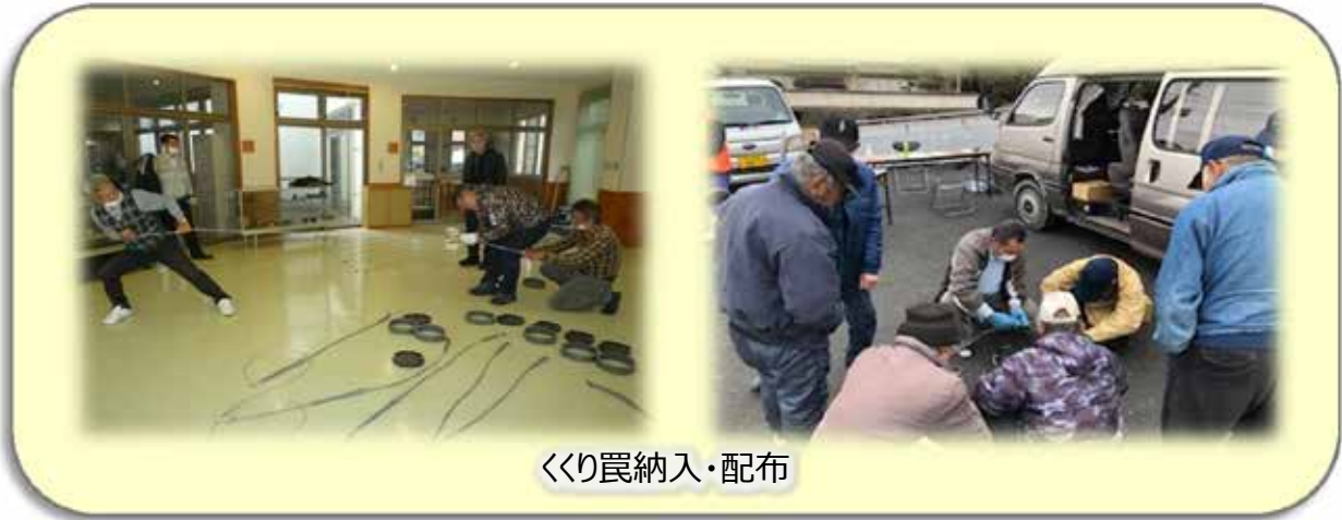
くくり罠納入・配布