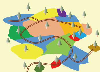
森林経営計画区域イメージ図

「森林所有者」又は「森林の経営の委託を受けた者」が、一体的に管理する区域を取りまとめて、間伐や作業道の計画を策定し、計画に基づいた効率的な森林整備を行うことで、健全な森林経営と森林の持つ公益的な機能を十分に発揮させることを目的とした5ヵ年の計画です。