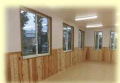
保育スペースの木質化