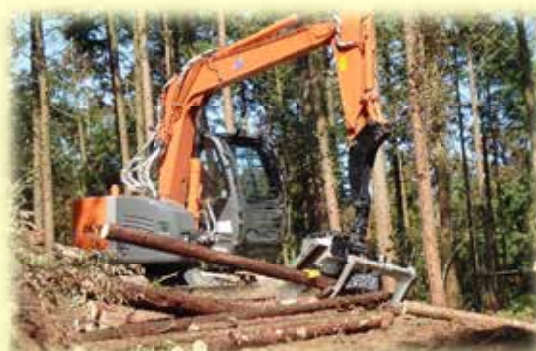
高性能林業機械活用状況