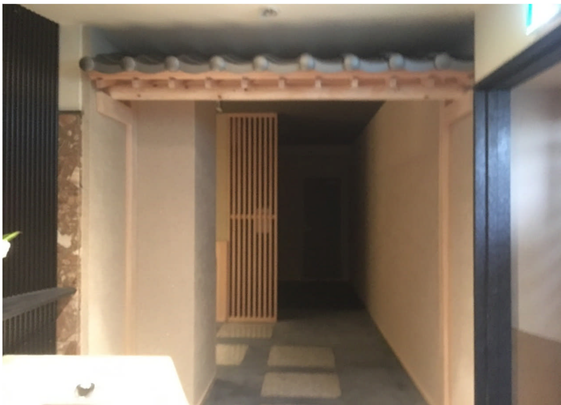
1階個室レストラン ※補助対象外