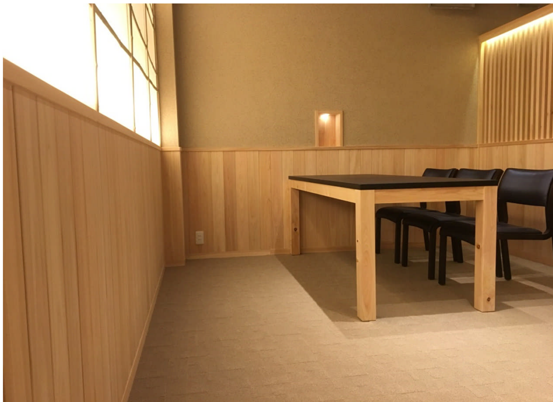
腰壁の木質化 間仕切り（箴欄間格子）