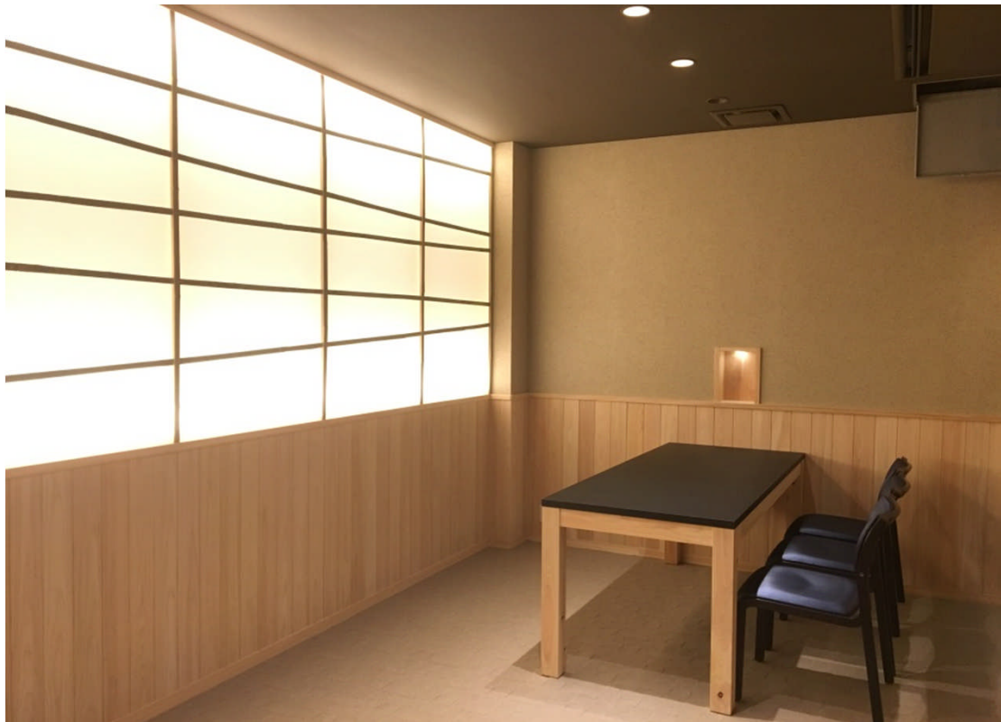
腰壁の木質化 間仕切り（箴欄間格子） 壁の間接照明がヒノキの優しさを引き立て、落ち着いた空間を演出