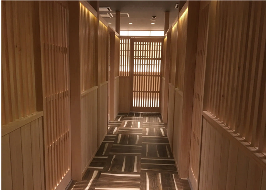
腰壁の木質化 間仕切り（箴欄間格子）、木製品 出入口格子戸