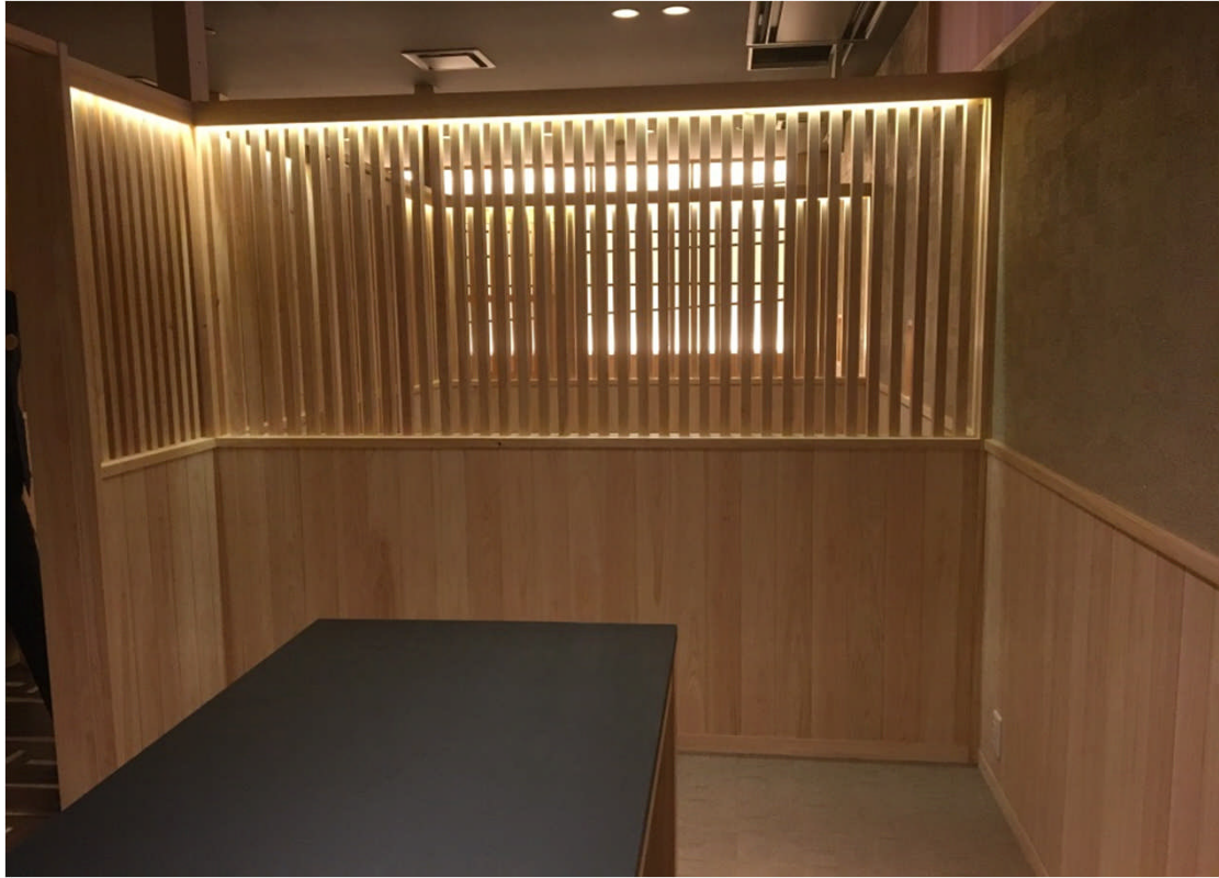
腰壁の木質化 間仕切り（箴欄間格子） 箴欄間格子の間接照明がヒノキの優しさを引き立て、落ち着いた空間を演出