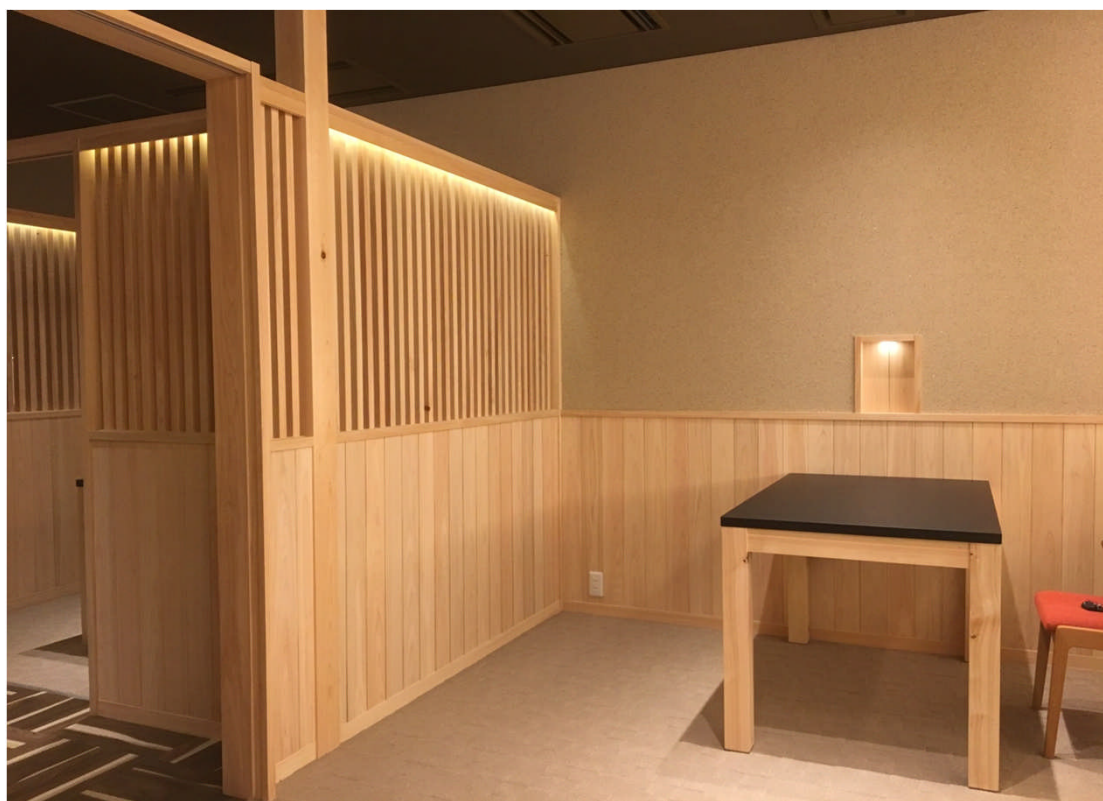
腰壁の木質化 間仕切り（箴欄間格子）