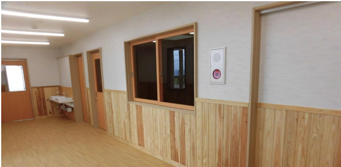
エントランス（腰壁）