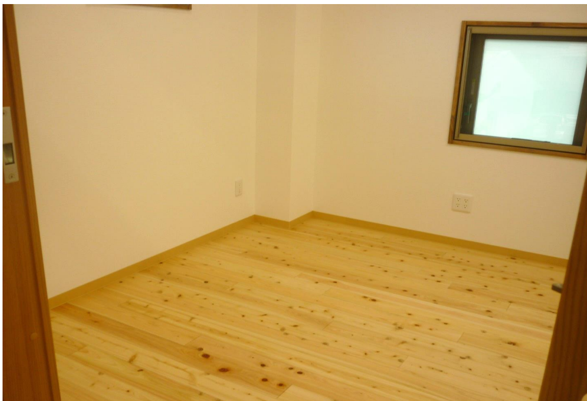
職員室（床フローリング）