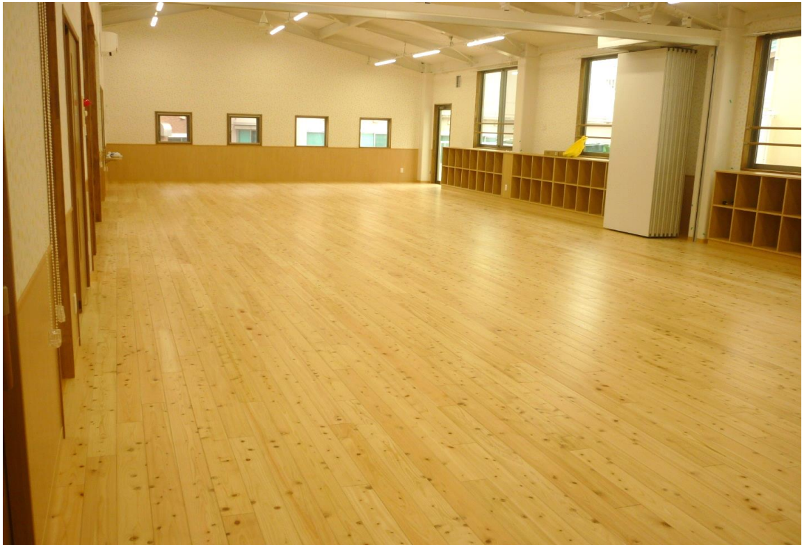
教室（床フローリング）