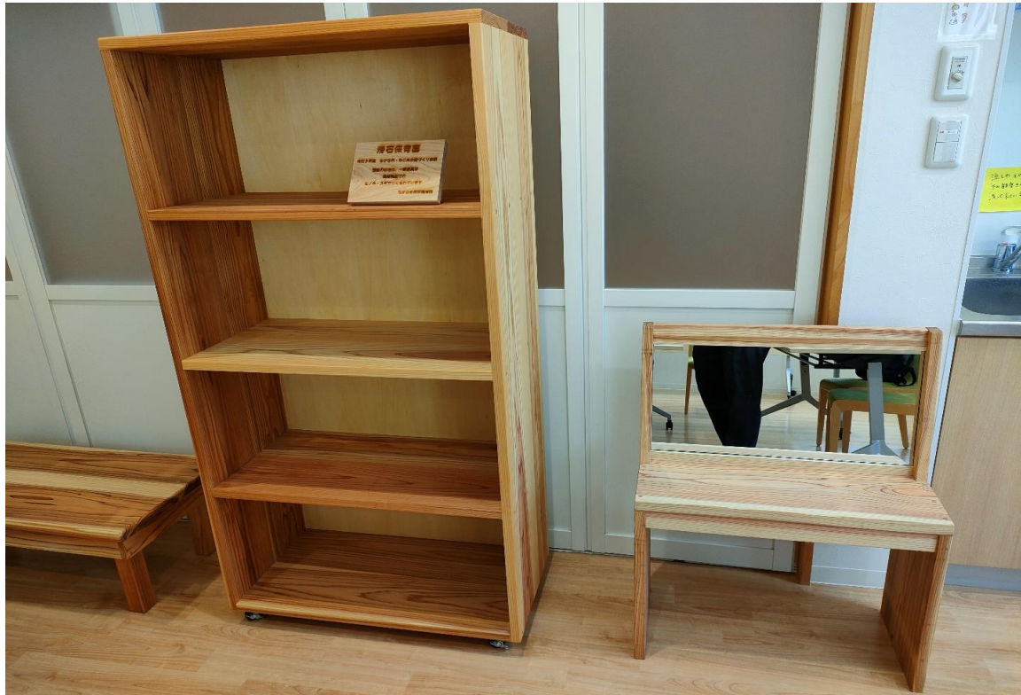
移動式書棚、ドレッサー