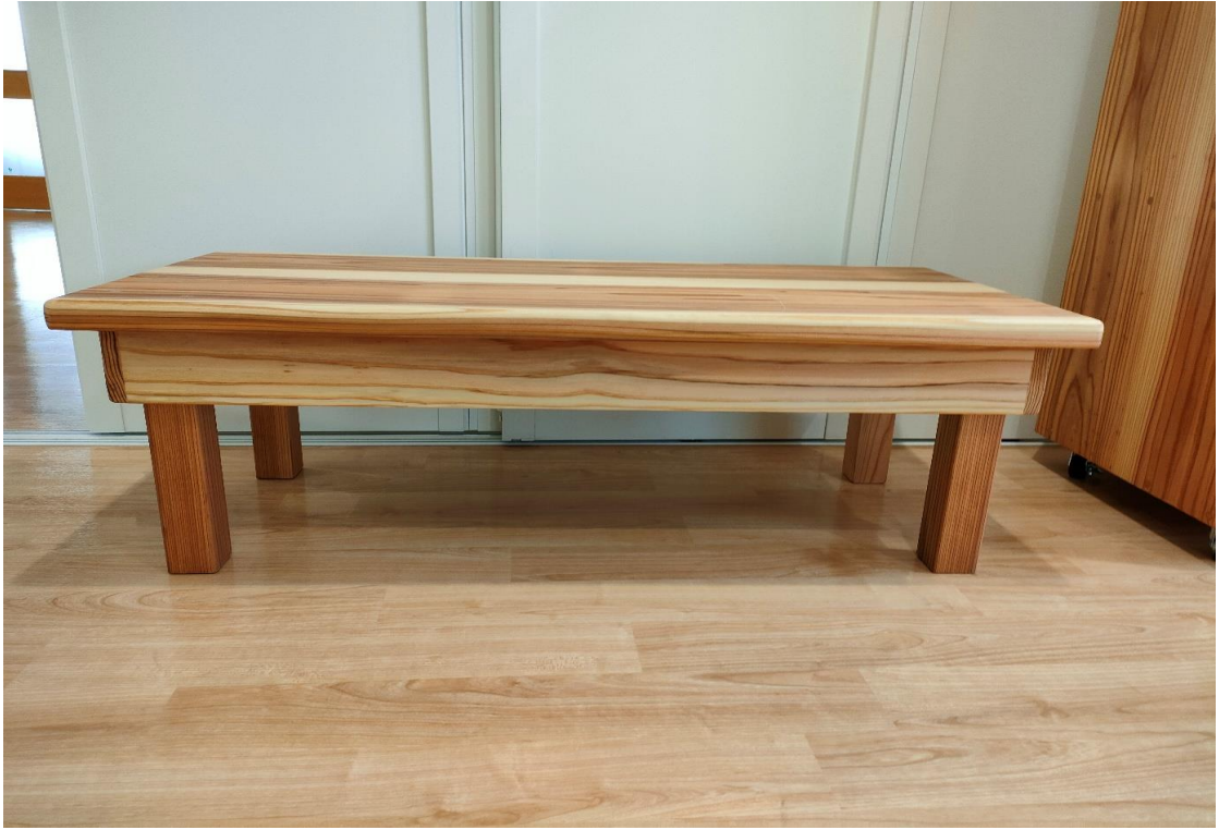
折り畳みテーブル