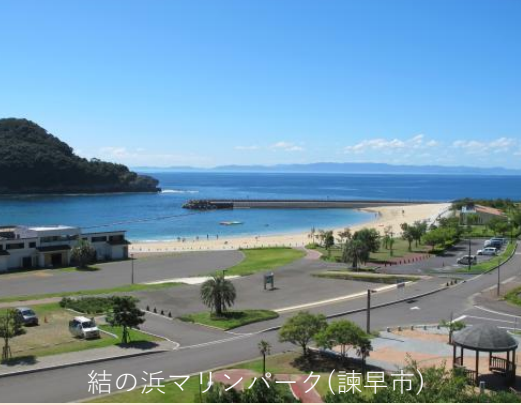
結の浜マリンパーク(諫早市)