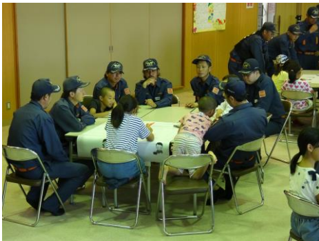
【小学生と防災ワークショップ活動】