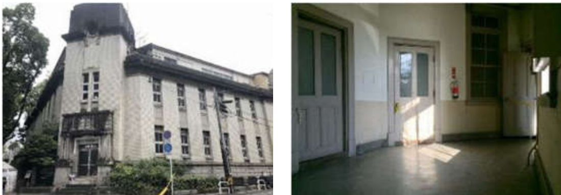
図 2-4 旧第三別館の現況（外観・内観）

旧第三別館は現在使用されていないが、耐震基準を満たしておらず、外壁等の劣化も進んでいることから、今後、保存活用する場合には、必要な設備の改修だけでなく、耐震改修工事や外壁等の改修工事が必要となる。