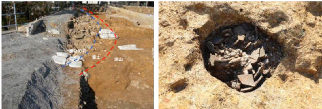
図 2-7 確認された石垣の裏込め石（左）と井戸と思われる遺構（右）

敷地西側付近において、令和元年度の調査で江戸時代の瓦などを含む土の層が確認されたことを受け、令和2年11月から令和3年2月まで、遺構の面的な広がりを確認するための内容確認調査を実施した。その結果、調査箇所からは、井戸と思われる遺構や石垣の裏込め石等が確認されたほか、令和元年度に確認された江戸時代の層の下に、明治期の生活面が確認され、西側部分は、明治時代に盛土して形成された土地であることがわかった。