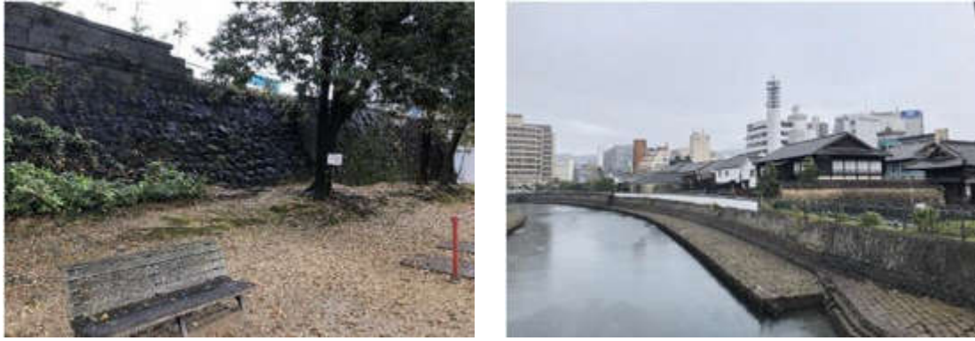
図 2-3 現存する石垣（写真左）と中島川と出島（写真右）