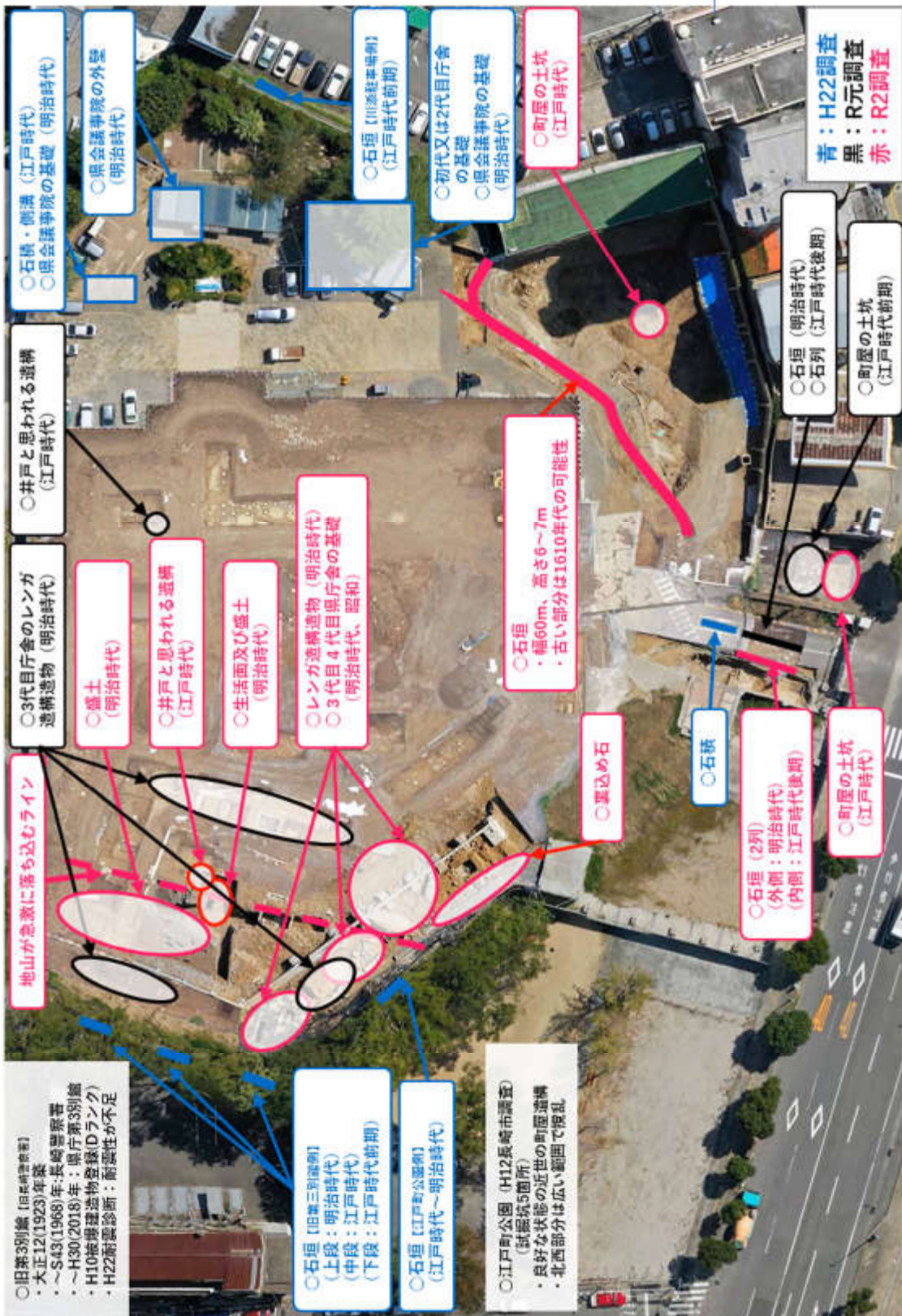
図 2-8 埋蔵文化財の確認状況