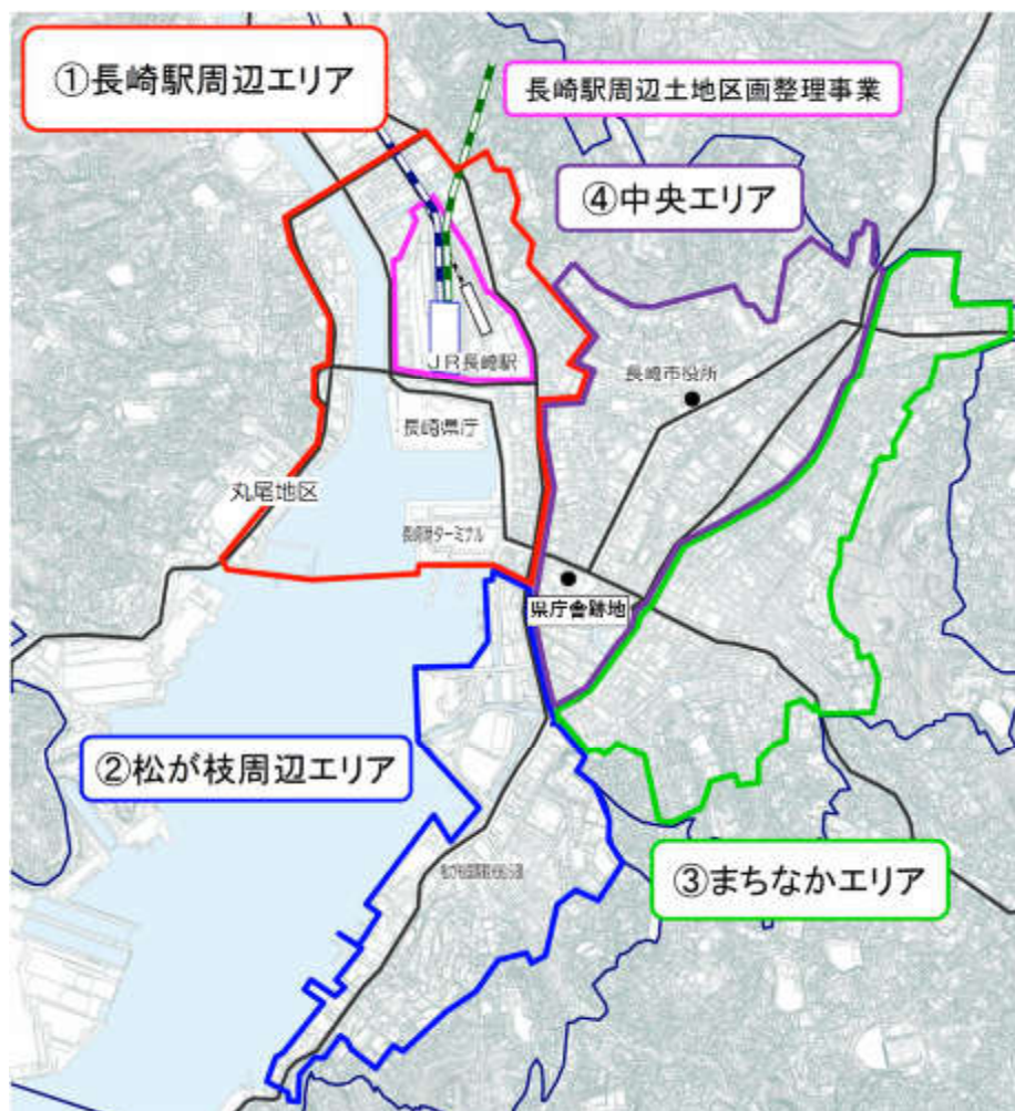
図 2-9 重点エリア図（長崎市・長崎県「長崎市中央部・臨海地域」中央エリア整備計画より）