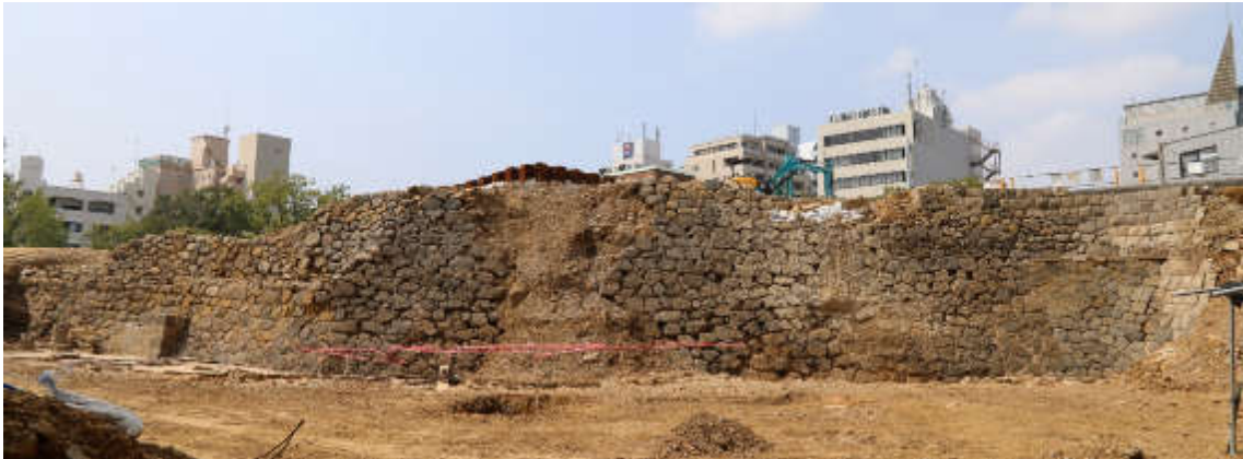
図 2-6 確認された敷地南側の石垣の遠景

令和元年度の調査結果を踏まえ、石垣や町屋の遺構等の残存状況を確認したところ、石垣部分については、長さ約60m、高さ約6～7mの石垣を検出し、補修や積み替えが繰り返し行われたことや、1610年代に積まれた可能性が高い根石部分などが確認された。また、町屋の遺構等を確認していた区域の調査においては、江戸時代の地層等が確認された。