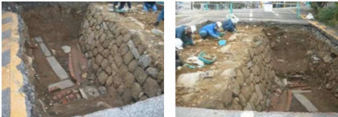
図 2-5 確認された石垣

これらの調査結果を踏まえ、埋蔵文化財等の専門家から、更に詳細な調査の実施を検討してほしい等の意見があり、令和 2 年 1 月、県として、今回出土した遺構等の周辺について、さらに詳細な調査を行う必要があると判断した。