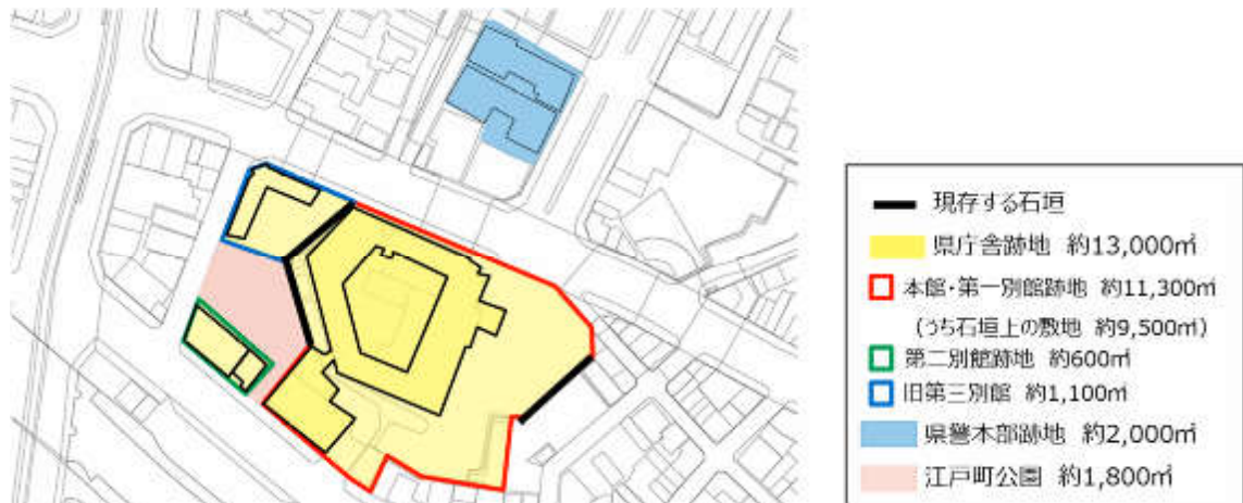
図 2-2 県庁舎跡地および県警本部跡地活用の対象