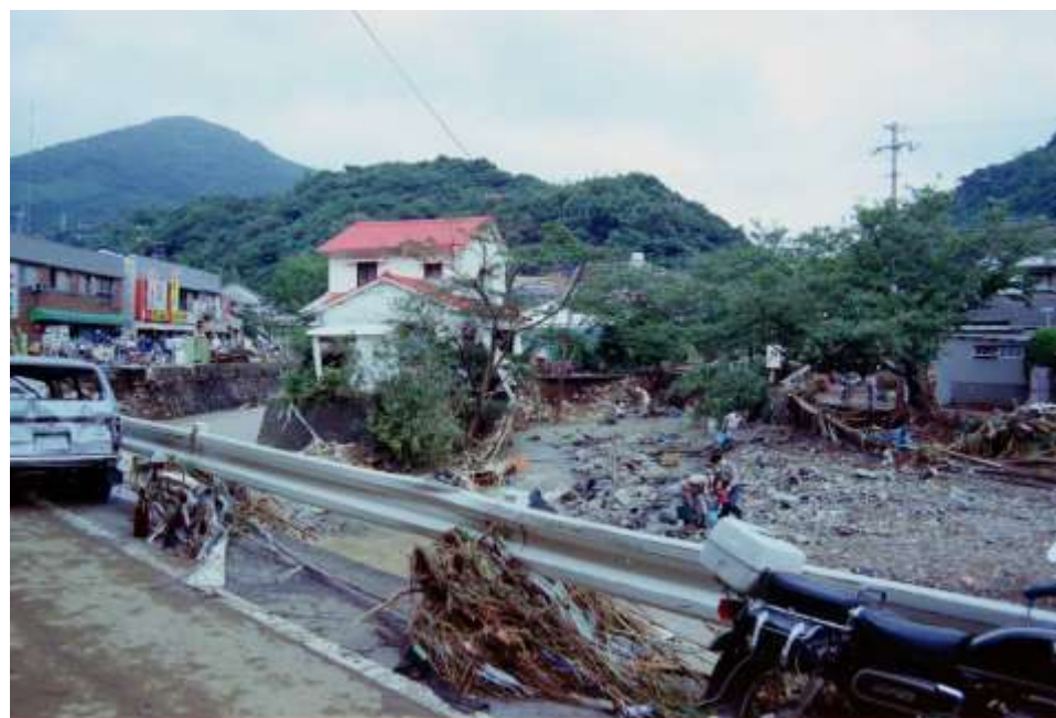
浦上川の被災状況