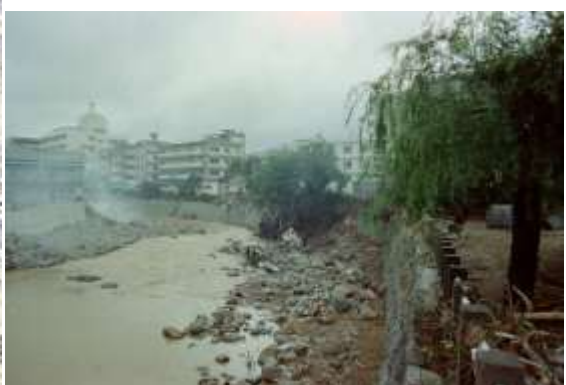
②純心中学校付近被災状況