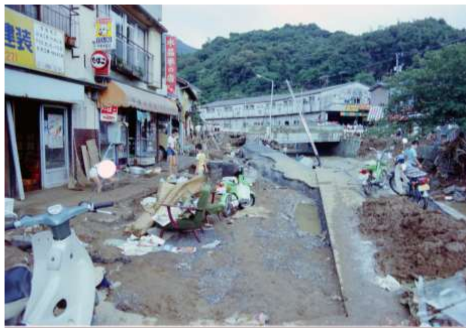
支川三川川の合流地点付近の被災状況