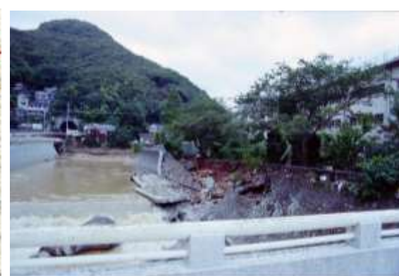
①西浦上小学校前被災状況