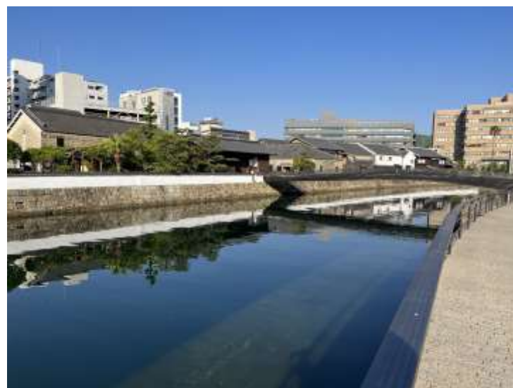
（出島と出島表門橋）