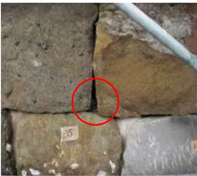
（水抜きパイプ設置箇所の石積み表面）

しかし、水抜きパイプが石積み表に出てくるとは景観を損なうため、表から見えないように水抜きパイプは石材と石材の継ぎ目（合端）の奥に設置しました。また、石材裏に打設するコンクリートやコンクリート構造物に必要な目地材についても石積み表から見えないよう工夫がなされました。