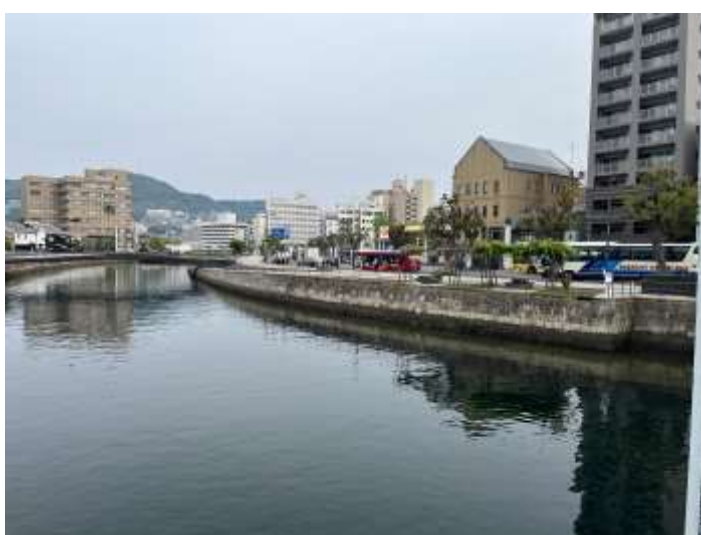
（改修工事完了後の石積み護岸）

中島川変流部護岸は第1次長崎港改修事業の唯一の遺構であり貴重な土木遺産であるとの評価を受け「平成29年土木学会選奨土木遺産」に認定されました。