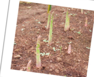
長崎県は全国上位のアスパラガス栽培面積！