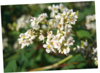
対馬在来の対州そば！