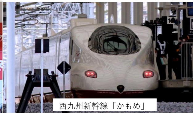
西九州新幹線「かもめ」