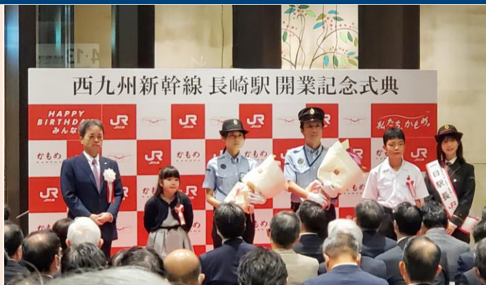
西九州新幹線 長崎駅 開業記念式典

令和4年9月23日(祝金)、西九州新幹線が開業しました。長崎、諫早、大村の各駅で開業イベントが開催され、大いににぎわいました。現行の特急より約30分短縮され最速で1時間20分になり、乗り心地も大きく改善されます。皆様、長崎にお越しの際には是非ご乗車ください。