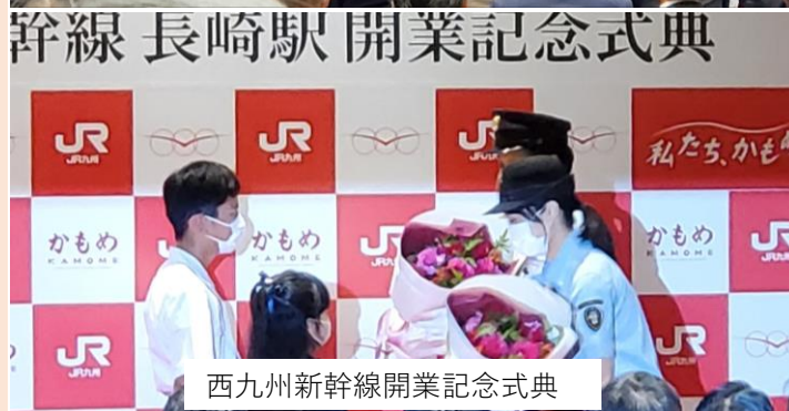
西九州新幹線開業記念式典

令和4年9月23日(祝金)、西九州新幹線が開業しました。長崎、諫早、大村の各駅で開業イベントが開催され、大いににぎわいました。現行の特急より約30分短縮され最速で1時間20分になり、乗り心地も大きく改善されます。皆様、長崎にお越しの際には是非ご乗車ください。