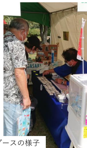
佐賀・長崎共同ブースの様子