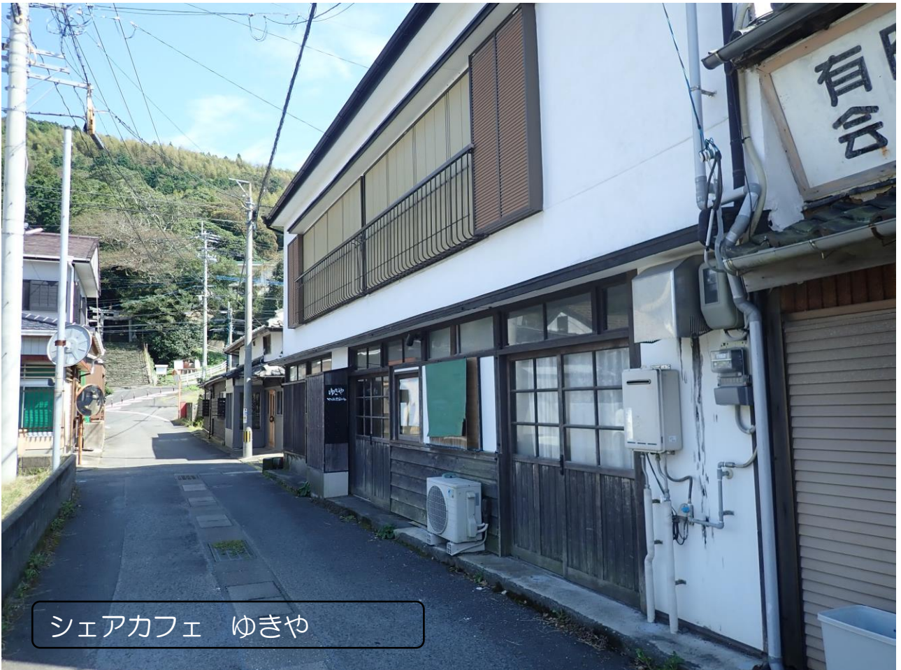
シェアカフェ ゆきや