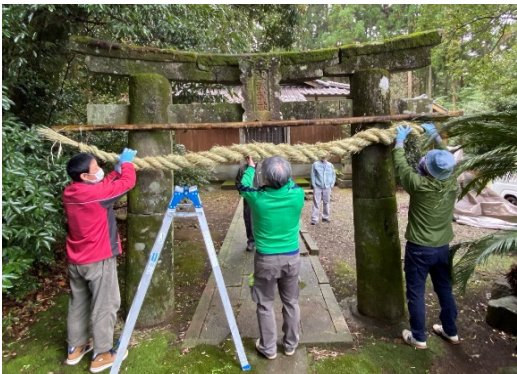
< 神 社 >