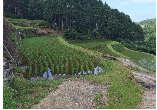
< 棚 田 >