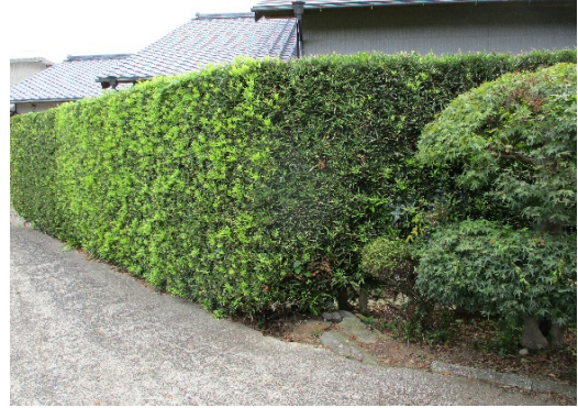
< 生 垣 >