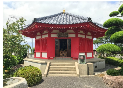
< 観音堂 >