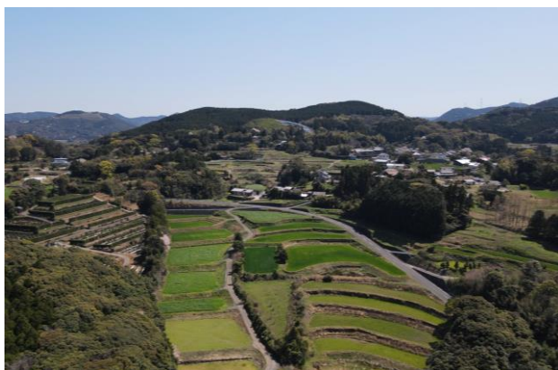
<のどかな田園風景>