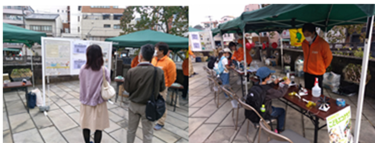
図2 ながさきエコ・ライフフェスタの様子