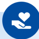
突然死葬祭費用保険

突然死（急性心不全、脳内出血などによる死亡）に際し、親族が負担した葬祭費用を補償