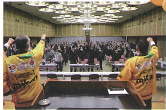
「がんばろう三唱」で一致団結