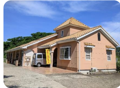
根獅子・飯良まちづくり運営協議会