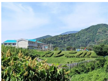
平戸市立根獅子小学校

集落内に小学校、近隣に中学校、高等学校があります。お買い物は集落内の商店の他、コンビニエンスストアが毎週移動販売に訪れます。