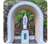
ルルドの MARIA 様