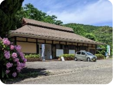
平戸市切支丹資料館