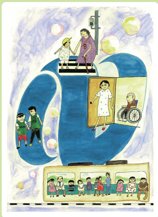
令和5年度 長崎県「障害者週間のポスター」 小学生部門 長崎県知事賞（最優秀賞）