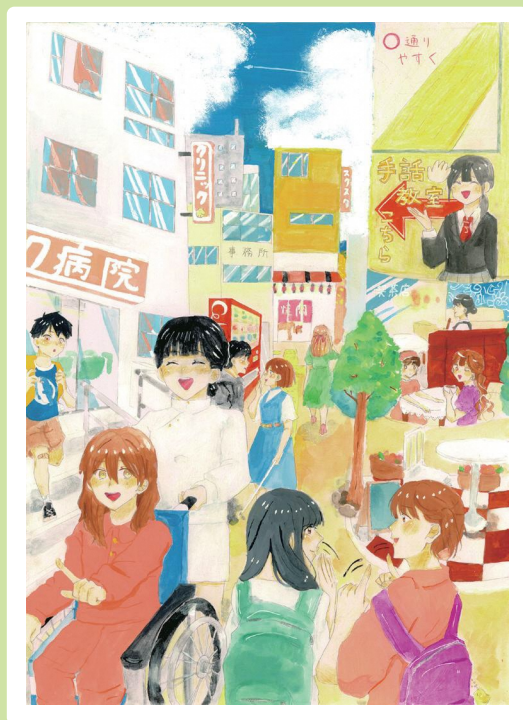
令和5年度 長崎県「障害者週間のポスター」 中学生部門 長崎県知事賞（最優秀賞）