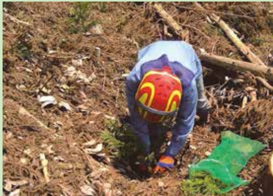
コンテナ苗の植栽状況