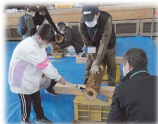
移動型おもちゃ美術館の開催