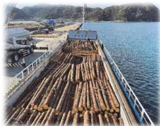
間伐材の出荷状況