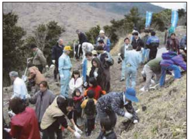
県民参加の森林づくり