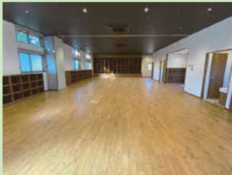
教育・保育スペースの木質化