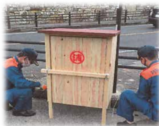
対馬産ヒノキ材の消火栓箱設置