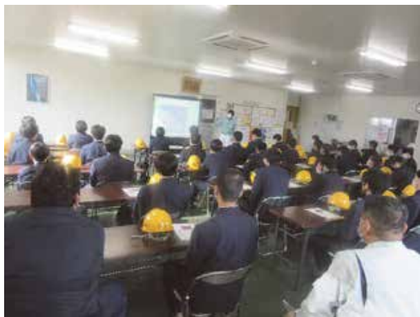
高校生への林業就業支援