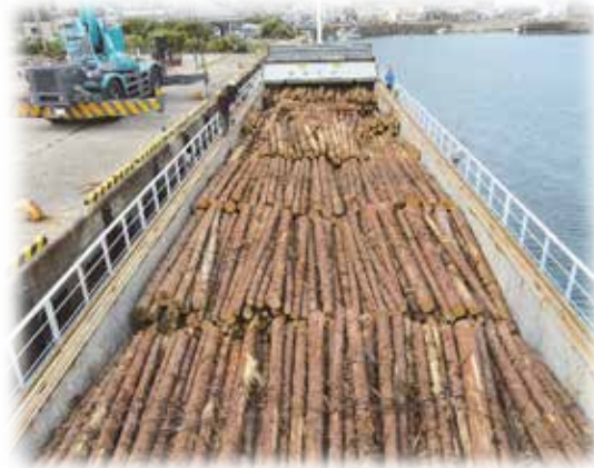
間伐材の出荷状況