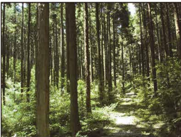
環境重視の森林づくり