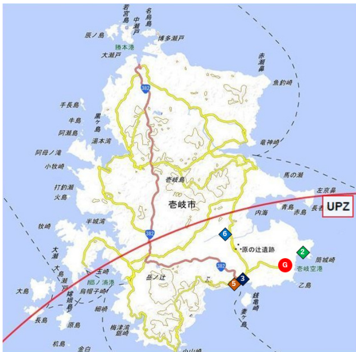
図 11 調査地点詳細 壱岐市