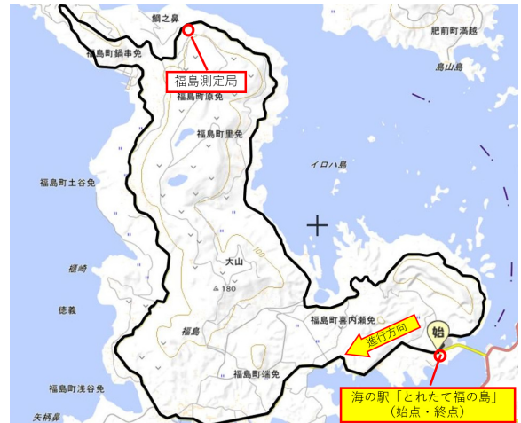
図3 Aルート(松浦市福島町)