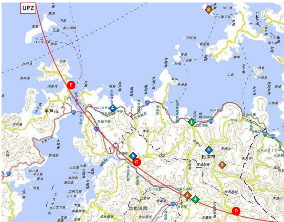
図9 調査地点詳細 松浦市、平戸市、佐世保市