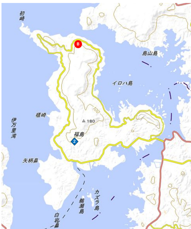
図8 調査地点詳細 松浦市福島