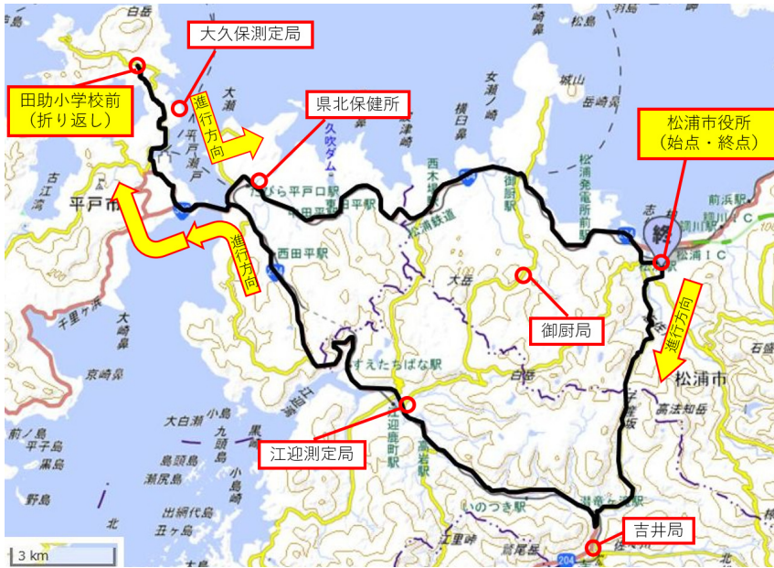
図5 Cルート(松浦市・佐世保市・平戸市)