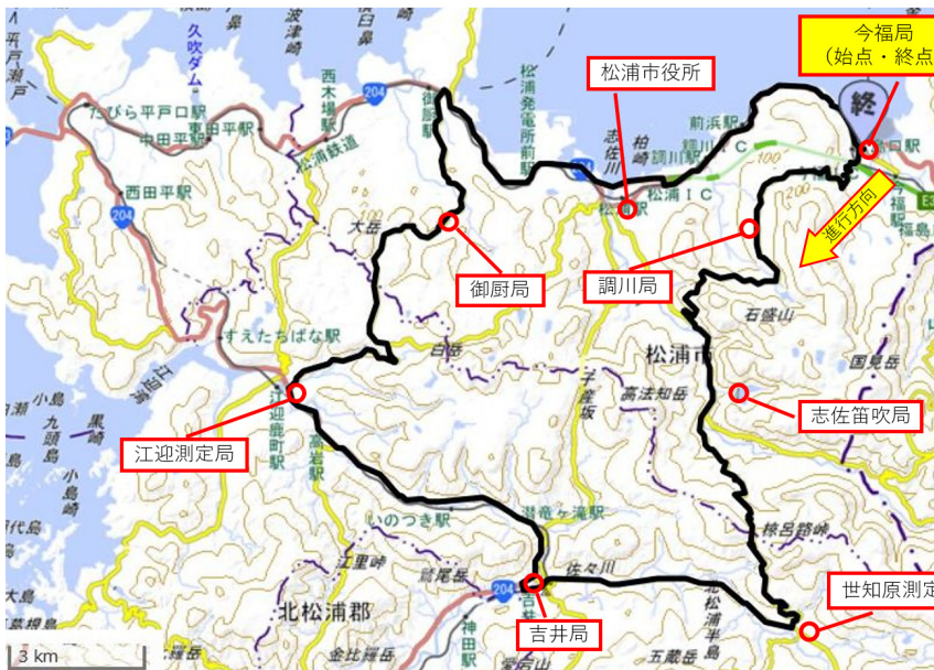
図4 Bルート(松浦市・佐世保市)