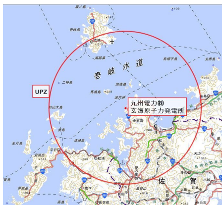
図1 モニタリング調査エリア全体図

原子力規制委員会は、東京電力(株)福島第一原子力発電所事故後に原子力災害対策指針(2012年10月31日)を制定し、原発から半径30 km 圏内を緊急防護措置準備区域(Urgent Protective Action Planning Zone(以下、「UPZ」という))と定め、平常時レベルの把握および緊急時の体制整備などを目的とした平常時モニタリング調査を実施する必要があるとしている。