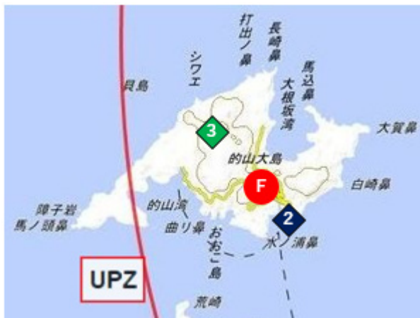
図10 調査地点詳細 平戸市の山大島