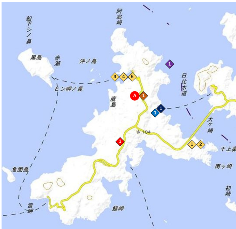
図7 調査地点詳細 松浦市鷹島