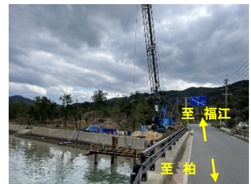
終点側 仮橋工事状況写真