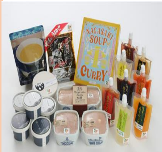
令和5年度新規認証商品

長崎県では、県産農畜産物を原材料とした加工品の中から、県民に愛され全国に誇れる商品を「長崎四季畑」として認証し、広く県内外にPRすることにより、県産農産加工品の認知度向上、農業者の所得向上に取り組んでいます。