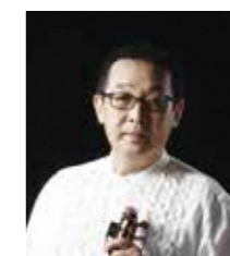
さだまさし氏 (本県出身シンガー・ ソングライター)