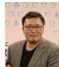
金沢知樹氏 (本県出身脚本家・ 演出家・映画監督)