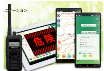
行動履歴記録アプリ

下記2つのアプリの連携システムを構築し、作業日報、施業コスト管理を自動記録化。プランナー業務の効率化を図る。