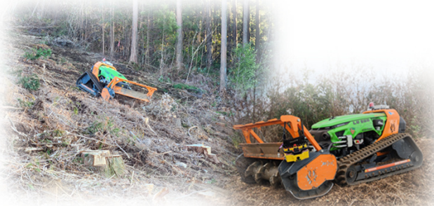
ラジコン式地拵え機

人力作業での負担が大きい枝条片付け、下刈り作業の機械化を進めるため、現地実証を行う。