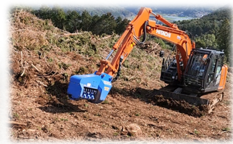
ロータリクラッシャー