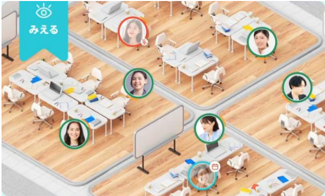
【オフィスイメージ】