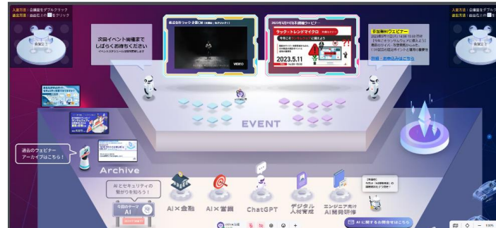
【イベントフィールドイメージ】