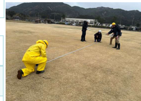
写真はイメージ