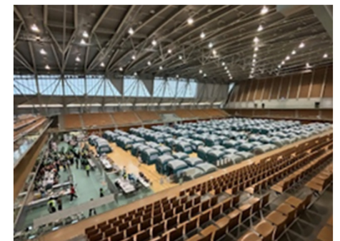
いしかわ総合スポーツセンター