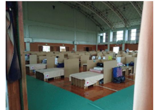
写真はイメージ