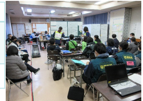
拠点での対策会議