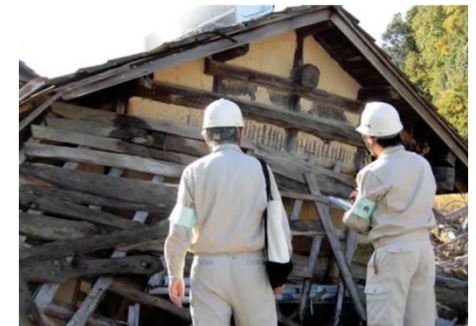
写真はイメージ