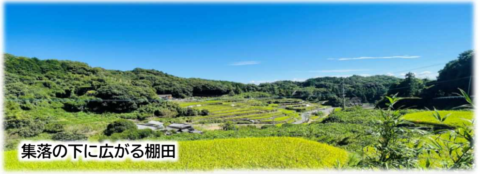
集落の下に広がる棚田