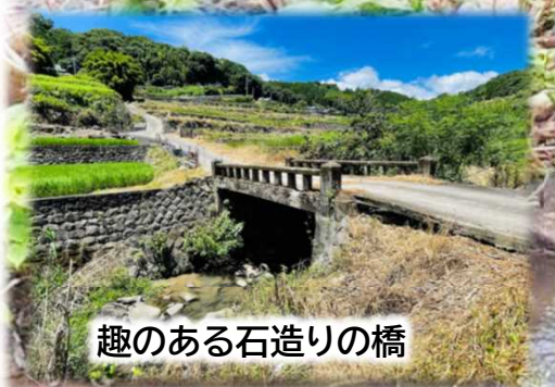
趣のある石造りの橋