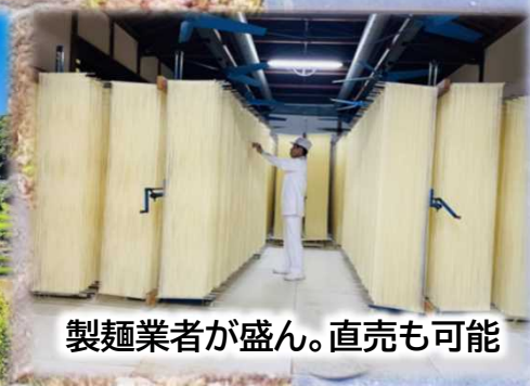
製麺業者が盛ん。直売も可能