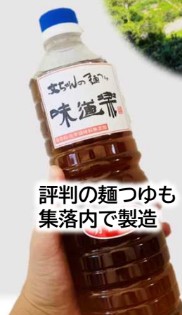
評判の麺つゆも 集落内で製造