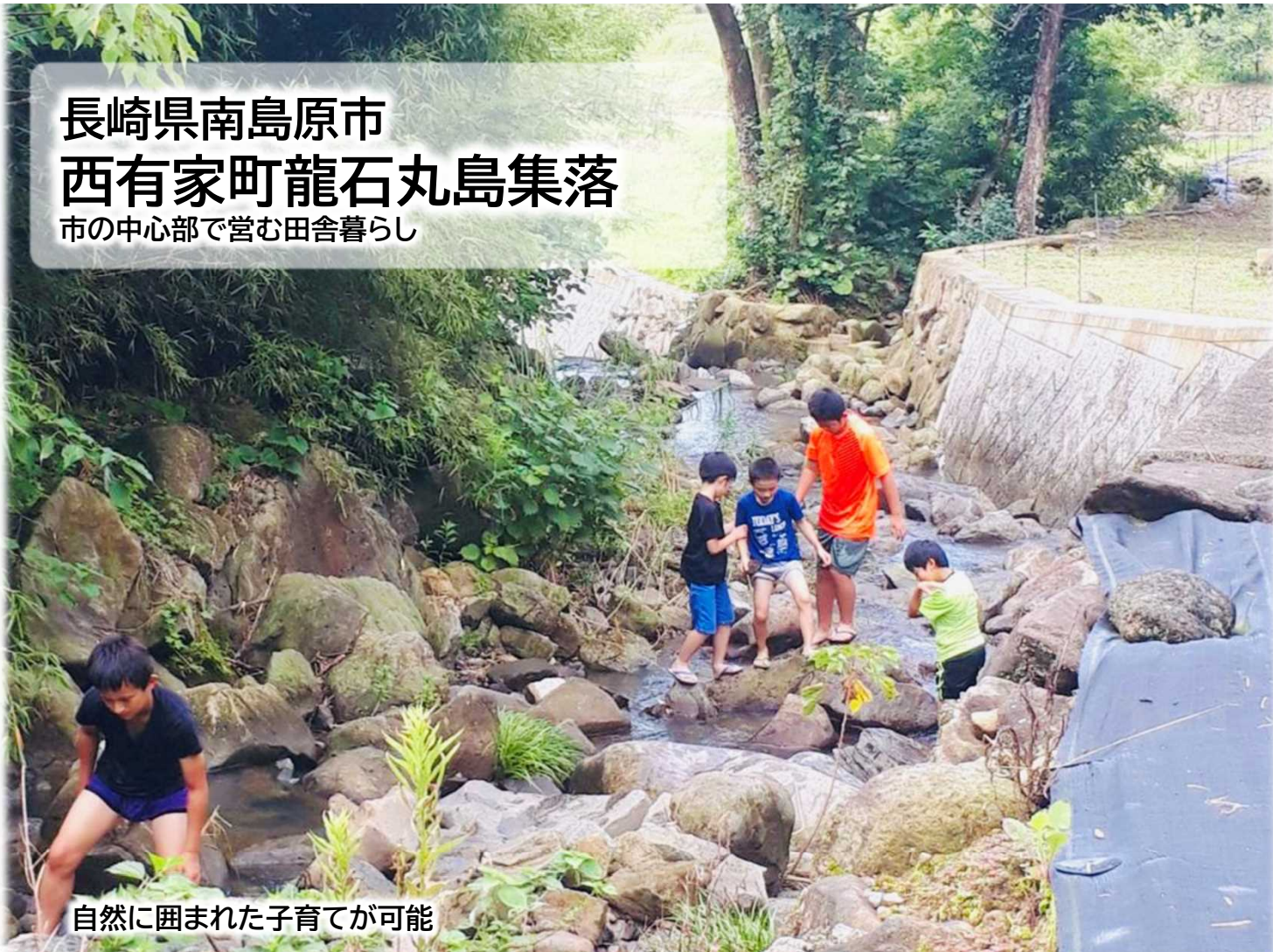
自然に囲まれた子育てが可能