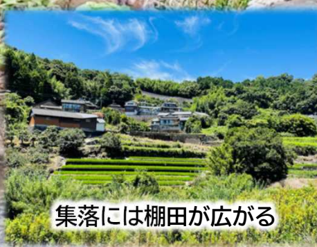
集落には棚田が広がる