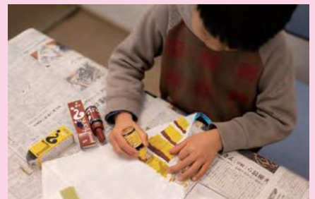
一銭バタの絵付け体験の様子

問合せ 長崎県実行委員会事務局(県のながさきピース文化祭課内) ☎095-895-2765