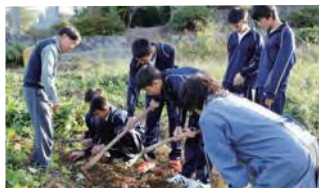
※農泊開業後の受け入れの様子

自宅などを活用した宿泊サービスを農林漁業体験と併せて提供する「農泊」の開業に興味のある方などを対象に、セミナーを開催します。