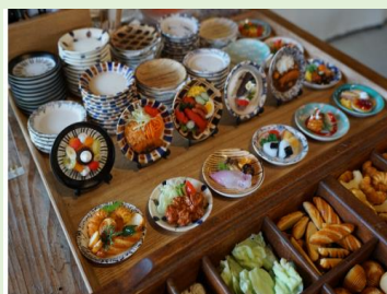
食品サンプル製作体験 ¥1,800

未経験の方でも簡単に絵付けができます。波佐見焼を気軽に体験できる人気のワークショップです。