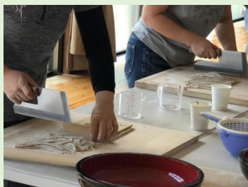
そば打ち体験 ¥2,000(食事付)

波佐見町の体験塾で人気のプログラム「そば塾」。自分で打ったそばを食してみませんか。