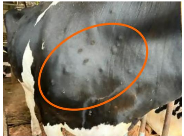
ランピースキン病発症牛 体表の結節