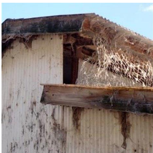
防鳥ネットの破れと鶏舎の壁の破損