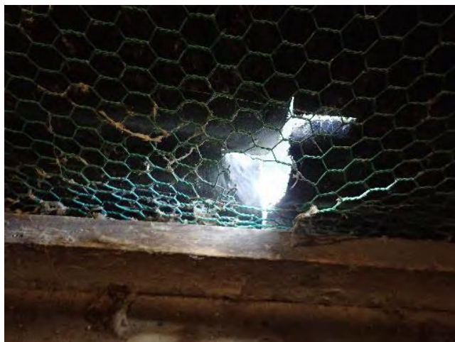
鶏舎の金網の破損