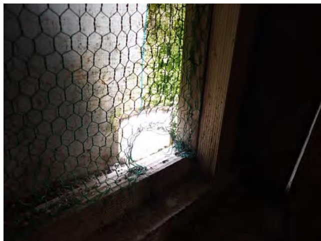
鶏舎の金網の破損

発生農場での疫学調査では、防鳥ネット、畜舎の壁・天井等に穴や破損箇所、隙間などが確認されています。現場に「隙」がないよう、日頃から点検と不備等が認めた場合は直ちに改善を図りましょう。