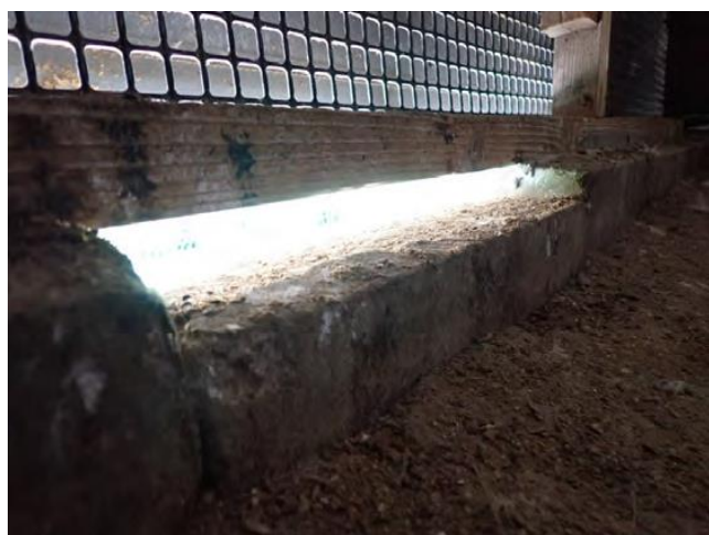
鶏舎排水口の閉鎖不全による隙間