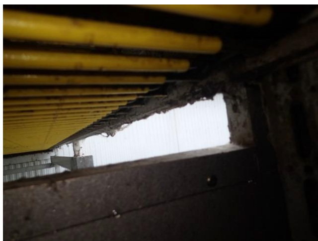
集卵コンベア開口部の隙間