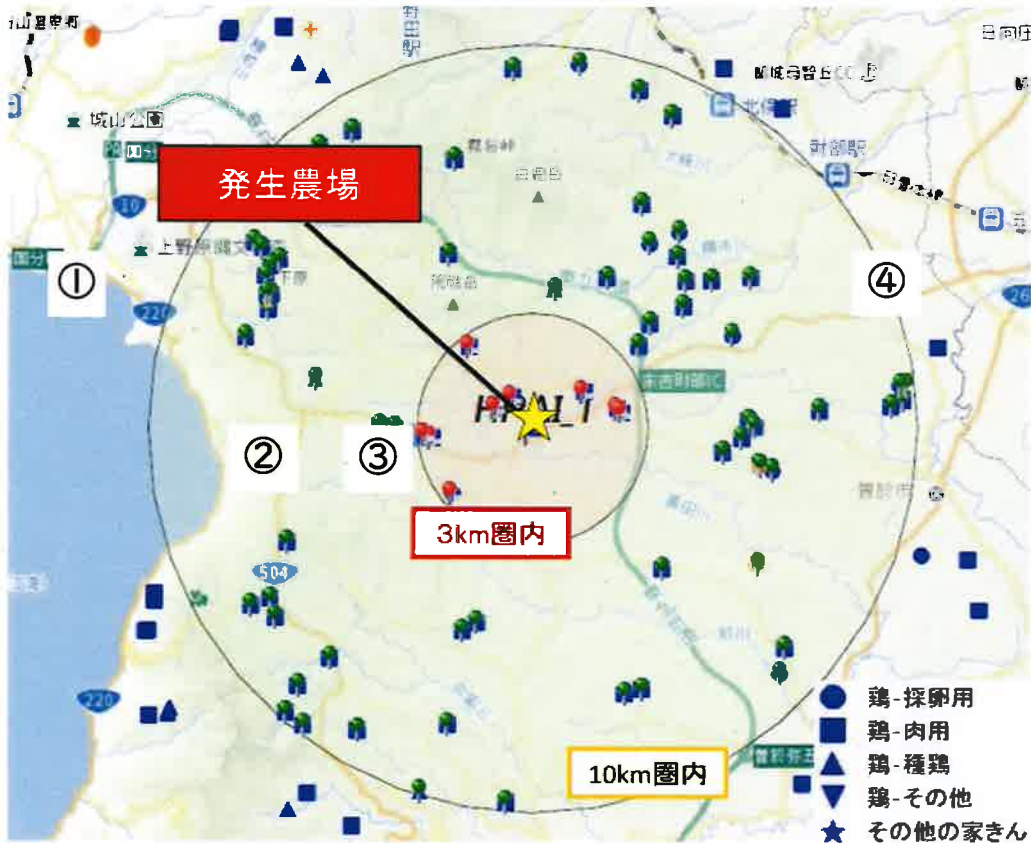
○制限区域内の飼養状況