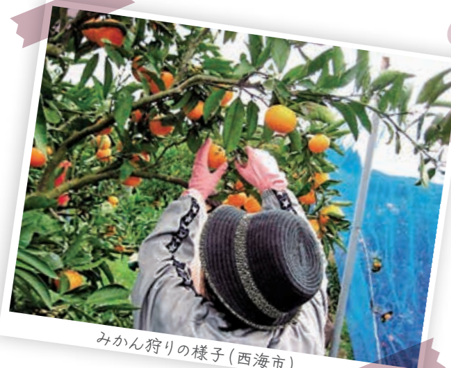
みかん狩りの様子(西海市)