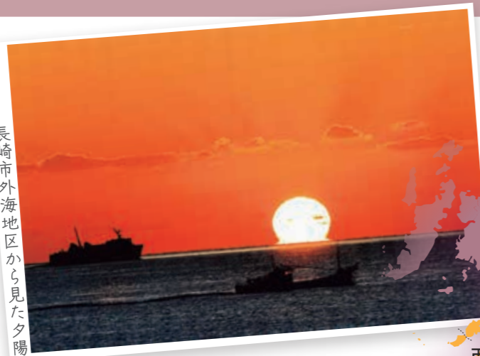
長崎市外海地区から見た夕陽

さらに、日本の近代化を支えた石炭の生産地でもあり、端島(通称軍艦島)や高島など世界遺産である「明治日本の産業革命遺産」の史跡が残る島も点在しています。