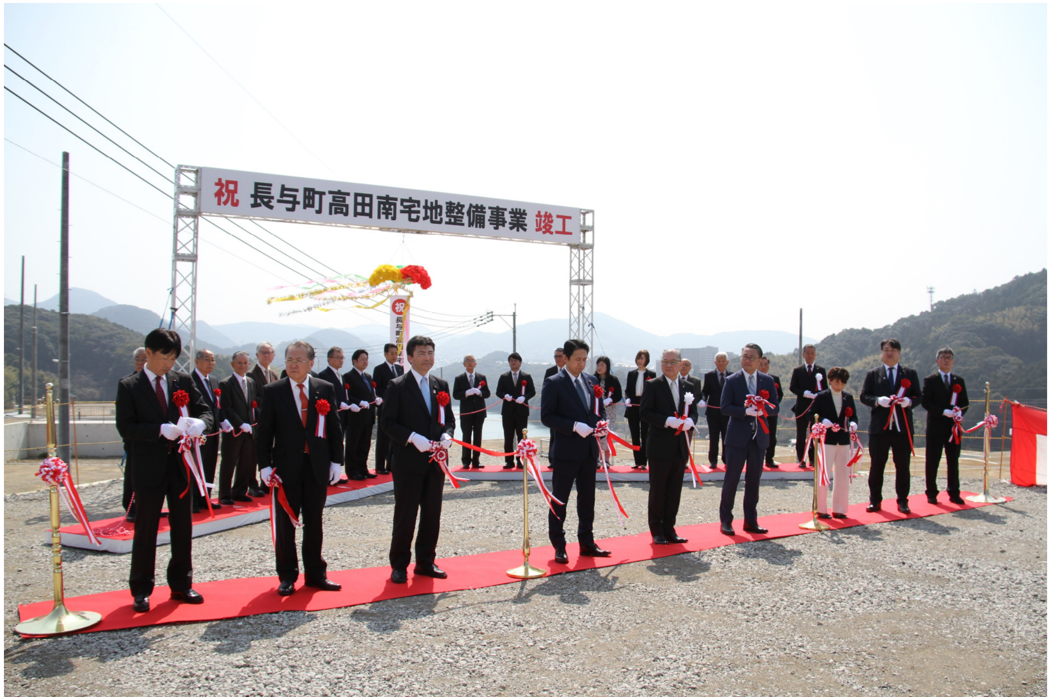
高田南宅地整備事業 竣工式典