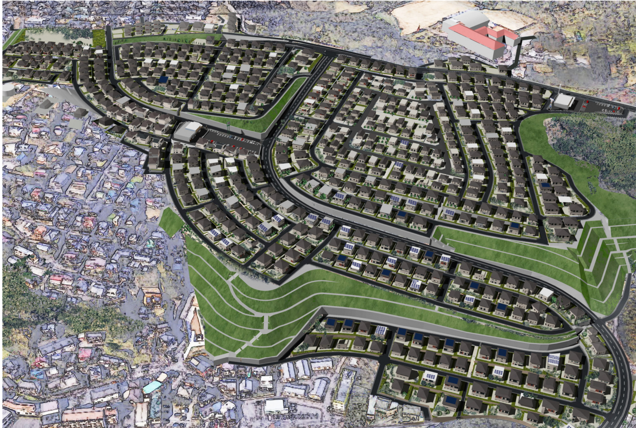
高田南宅地整備事業完成予想図