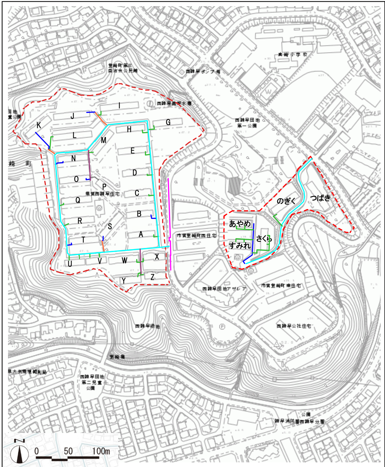
ガス配管図 (資料 九州ガス資料)