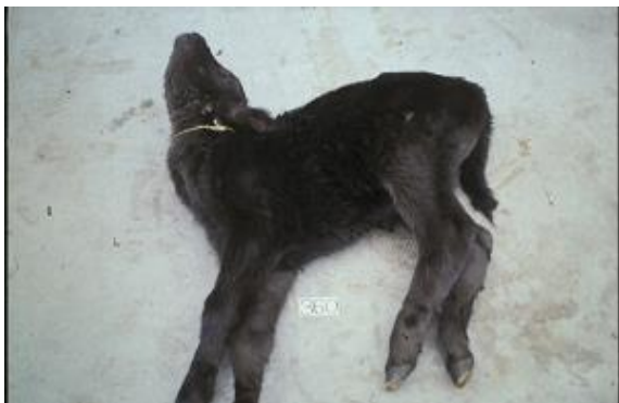
チュウザン病