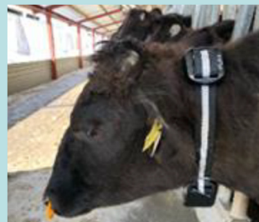
生体モニタリングシステム