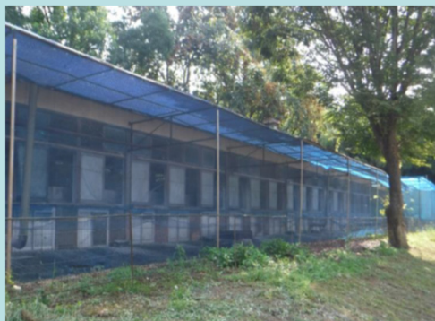
野生動物侵入防止のためのネットの設置