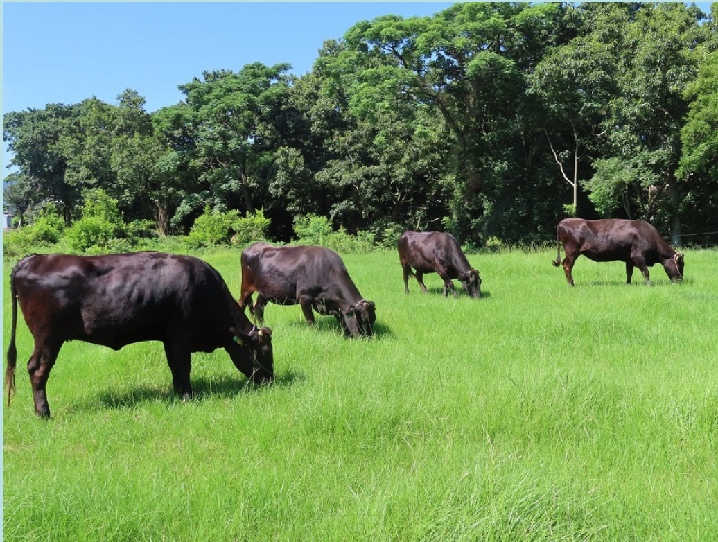
撮影場所:長崎県島原市

このように、豊かな自然と畜産に長い歴史を持つ長崎県は、県内外へ、良質で安全な畜産物の供給基地となっています。