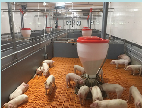
畜産クラスター構築事業を活用した豚舎整備