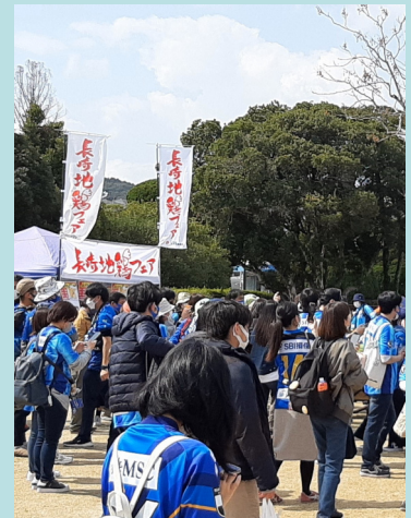
長崎地鶏フェアの開催による 消費拡大の取組