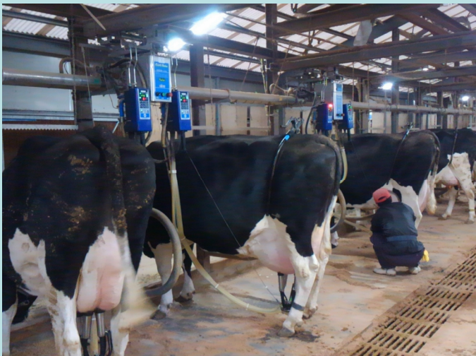
搾乳ユニット自動搬送パイプライン