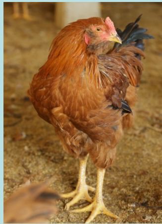
肉用専用種として流通している 「長崎対馬地どり」