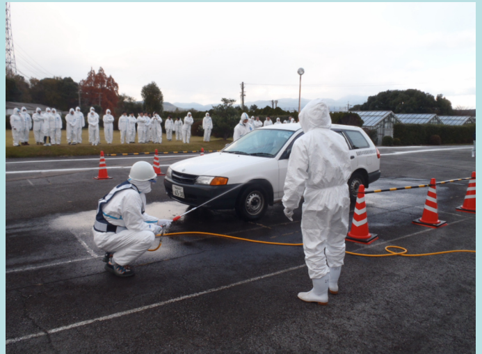
車両消毒作業の演習