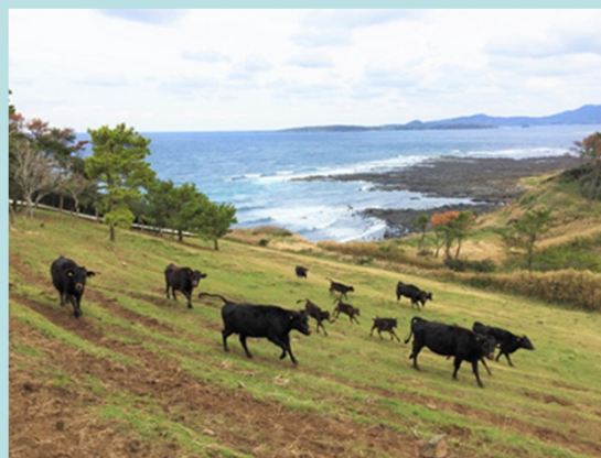
傾斜地を活用した放牧