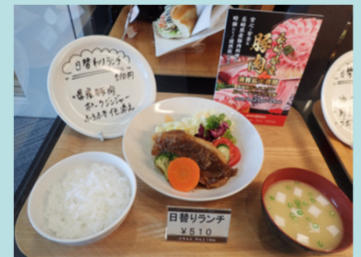
県庁レストランでの県産豚肉メニューのPR提供